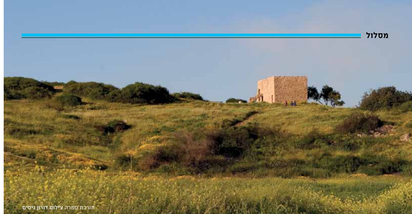
חורבת סמרה