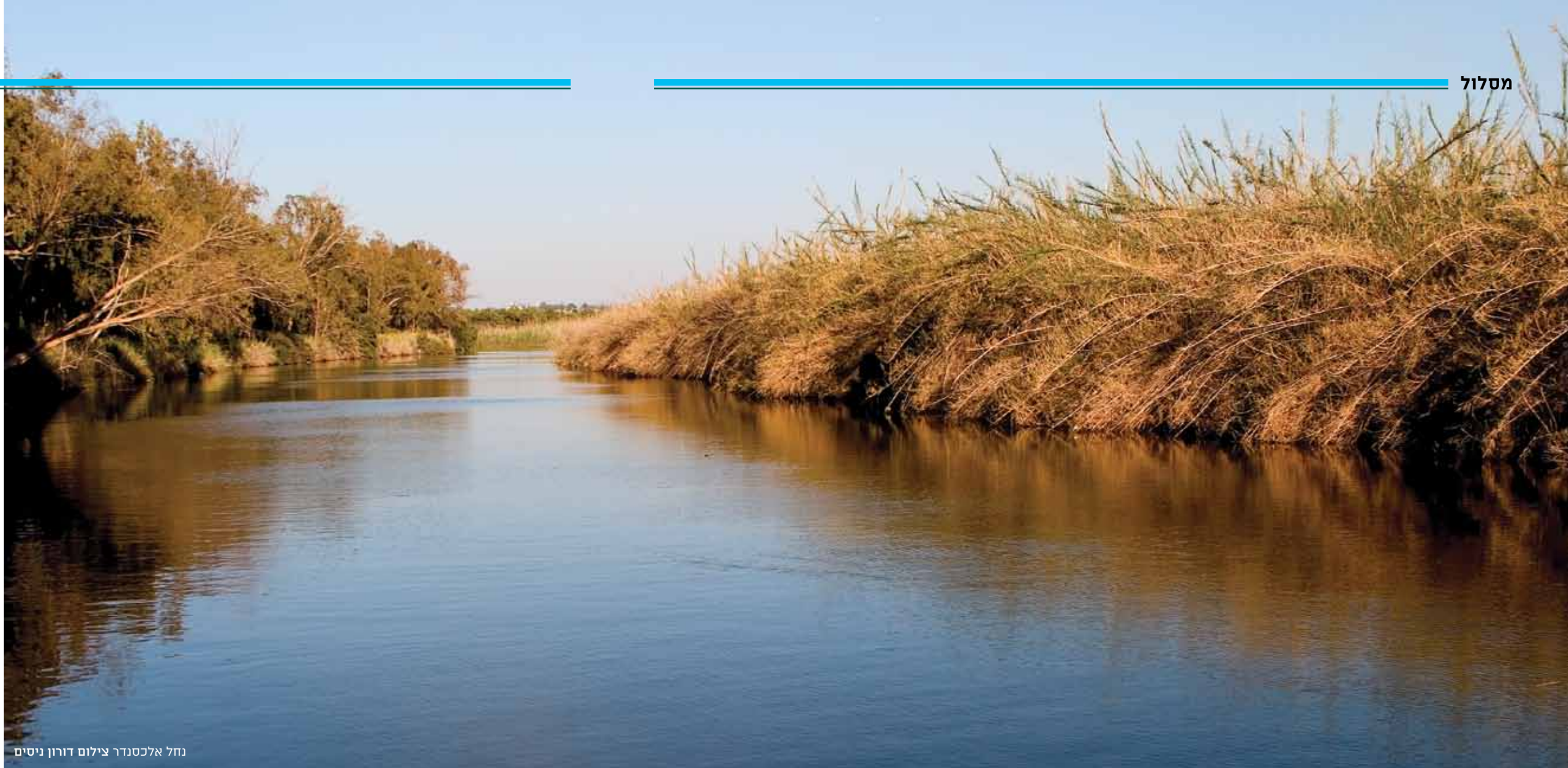
נחל אלכסנדר