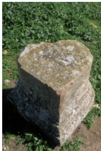
↓ פדיסטל "לב" מבית הכנסת

האתר נסקר כבר בסוף המאה ה-19 על ידי מגוון חוקרים, בהם אנשי הקרן הבריטית לחקר ארץ ישראל, וויקטור גרן הצרפתי, אינטלקטואל וארכיאולוג חובב, אך שרידי בית הכנסת נחשפו לראשונה רק בשנת 1905, על ידי הארכיאולוגים הגרמנים היינריך קוהל וקרל וצינגר.