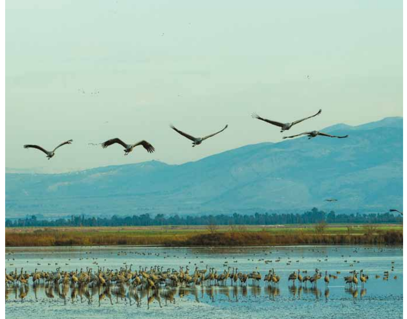
שמורת טבע החולה. תוצאה של המאבק הנחוש של אנשי הטבע על ערכי הטבע הנדירים שבה