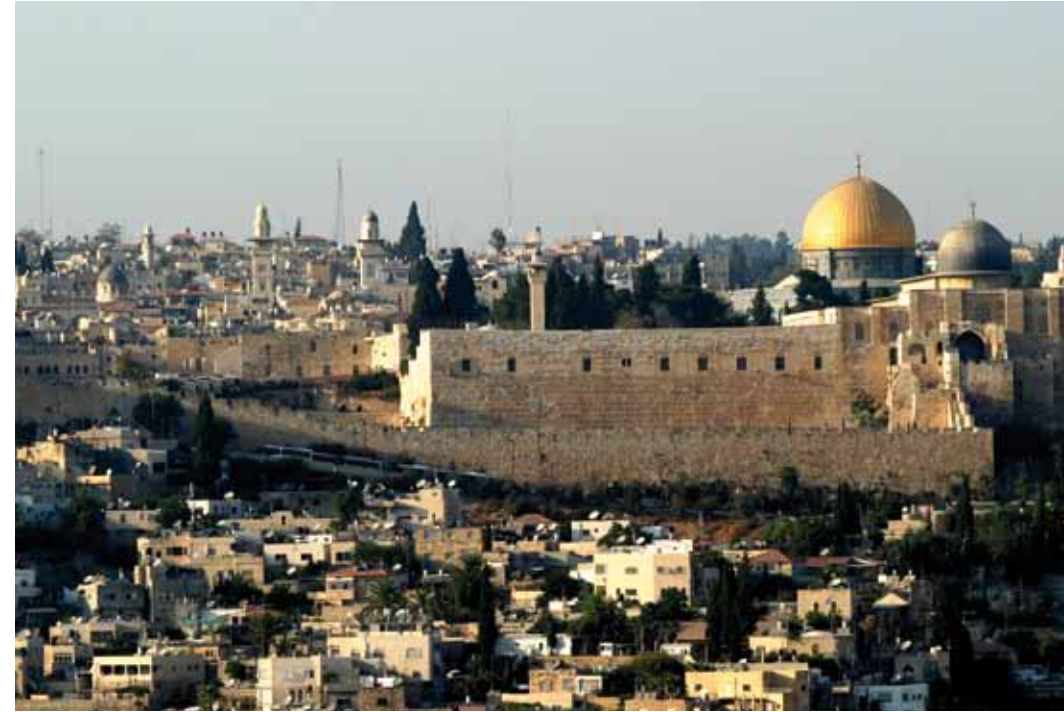
סדי קולק דחף את רעיון החיץ הירוק בלב העיר והביא להקמת גן לאומי סובב חומות ירושלים

הלל עומר (ע. הלל) כמעט כולם יודעים שההלל עומר, הידוע כע. הלל, היה סופר ומשורר פורה. תרומתו העצומה לנוף הארץ, כאדריכל נוף ישראלי, ידועה פחות. הלל נולד בקיבוץ משמר העמק, החל לכתוב שירים בגיל צעיר והשתתף במלחמת העצמאות. לאחר המלחמה שב לקיבוץ ועבד בנוי. בהמשך נסע לצרפת כדי ללמוד אדריכלות גנים ונוף וכשחזר החל בקריירה מפוארת בתחום עיצוב הגנים והנוף בישראל. אצל הלל, השירה והסיפורים קשורים היטב לטבע ולנוף הישראלי. שירתו מלאה בדימויי טבע ונוף, והוא כותב על רגשות ההתפעמות שלו מנופים מיוחדים ומרהיבים או מפריחות האביב. גם שירי הילדים שכתב מלאים באהבת הטבע, כמו למשל "בולבול למה ככה". הקריירה של הלל כאדריכל נוף הייתה מגוונת מאוד. הוא שימש כמתכנן גנים בעיריית ירושלים, כתב במגזין "גן ונוף" ואף ערך אותו במשך כמה שנים ותכנן חלקים נרחבים של ערים וקיבוצים. הלל עיצב, למעשה, נופים רבים שמוכרים לנו היטב. דוגמה מצוינת לעבודתו היא הפארק העירוני צ'ארלס קלור בחוף תל אביב, על התפר שבין תל אביב ליפו. הפארק הוקם על