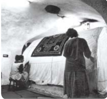
נשים מתפללות על קברו של שמואל הנביא

התקופה ההלניסטית: בשיפולים הדרומיים של האתר נחשף רובע מגורים שגודלו יותר משלושה דונם. הוא היה בנוי בצפיפות רבה והמבנים נשתמרו לגובה של 4.5 מטרים, לעתים