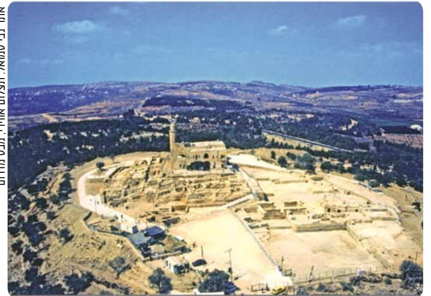
אתר נבי סמואל. תצלום אווירי. מבט מדרום

כלי חרס, מטבעות, פגזים ושרידי מבצר וכנסייה צלבנית שנחפרו באתר נבי סמואל לאורך שנים, מספרים את סיפורו המרתק של המקום המקודש לשלוש הדתות. עולים לרגל לנבי סמואל