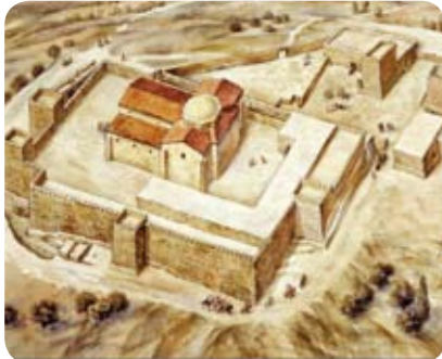
שיחזור המצודה הצלבנית