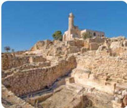
נבי סמואל: הרובע ההלניסטי

עד קומה שלישית. את הרובע מחלק רחוב שכיוונו מזרח-מערב, אורכו 55 מטרים ורוחבו 35 מטרים. מתחתיו נתגלתה תעלת מים שניקזה אותו. הרובע היה בנוי אבני גזית גדולות והקירות היו מכוסים בשכבה עבה של טיח. נחשפו מספר מבנים בנויים בקומות, חלקם סביב חצר מרכזית,