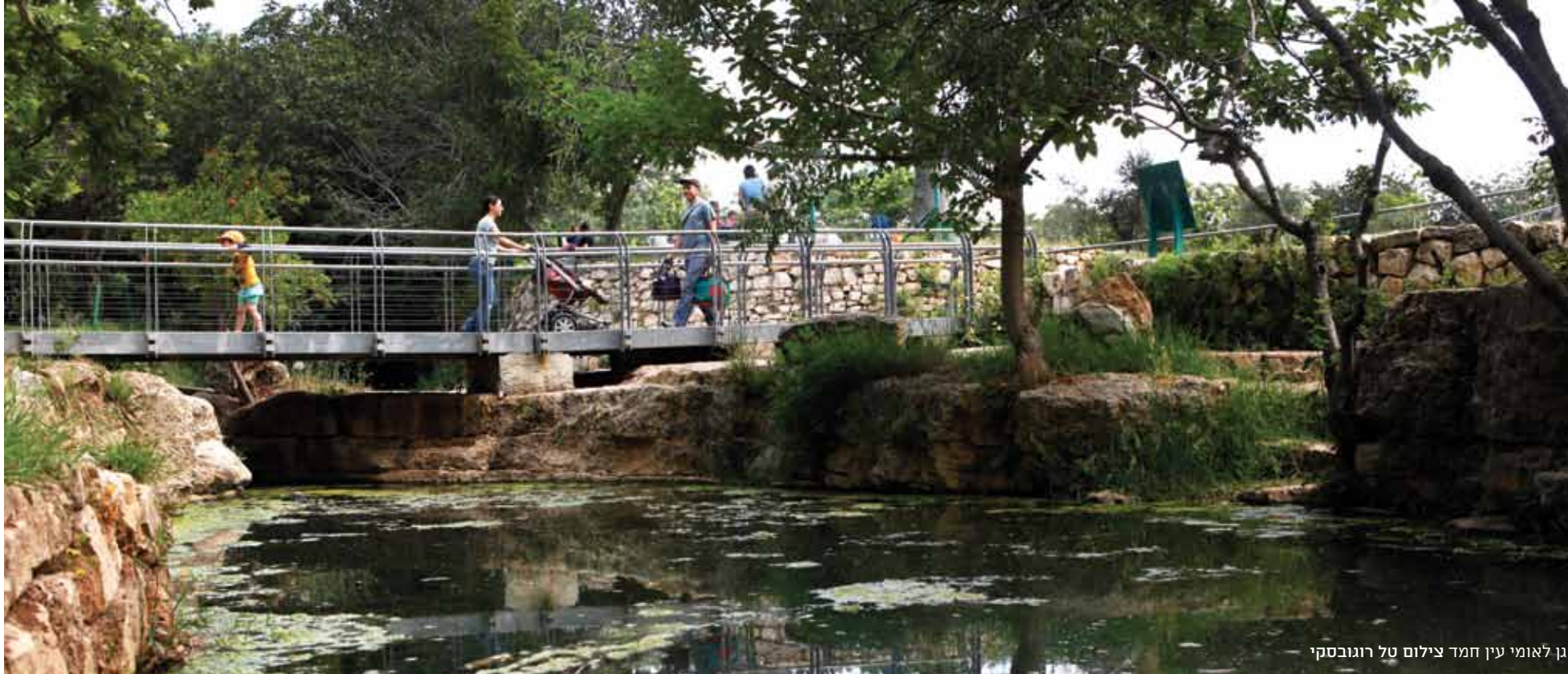
גן לאומי עין חמד

ארצי ונבע יוצאים לסיור עששיות בגן לאומי עין חמד, פוגשים עטלפים ולומדים עד כמה חשוב לשמור על חשכת הלילה ואיך עושים זאת כתבה: אדר סטולרו מליחי