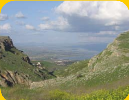
בקעת הארבל.