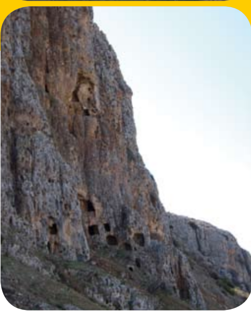
מערות חצובות בסלע.