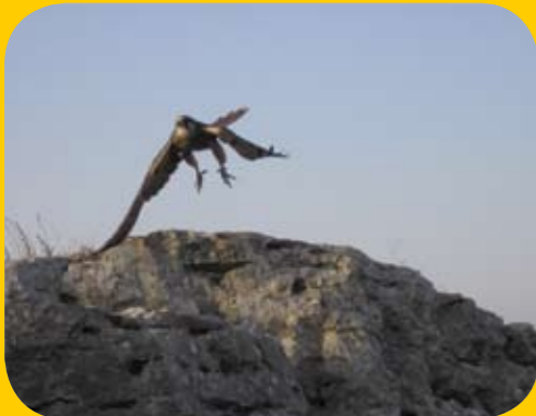
בז צוקים בארבל.

אחר כך נפרדנו מהמצוק, טיפסנו בחזרה במעלה השביל ונעזרנו שוב בידיות האחיזה ובכבלים המתוחים על הסלעים. לאחר מנוחה קלה, נסענו לכנרת כדי לשבת ולאכול על שפתה. בזווית עינינו התנשא מצוק הארבל - בגודלו המרשים ובצורתו המיוחדת.