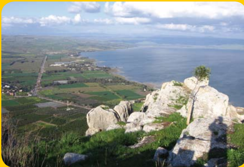
תצפית מהארבל צפונית - מזרחית.

לרגל שבוע האהבה לטבע נוסעים ארצי וגבע לגן לאומי ושמורת טבע ארבל, לציין שנה לפתיחתו, לטייל, ללמוד על האזור וליהנות מהנוף הנשקף ממרומי המצוק