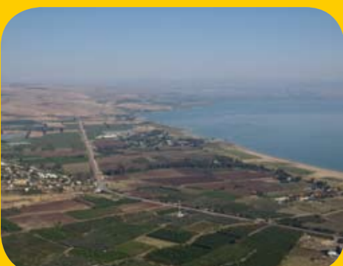
הנוף הנשקף מהארבל לכיוון צפון.