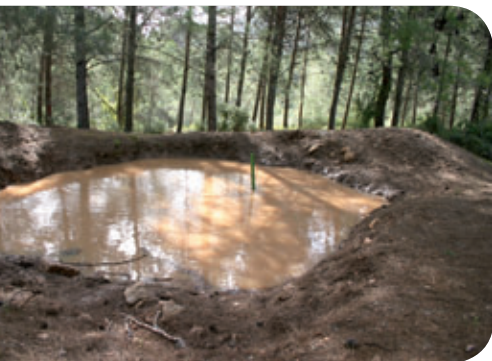
בריכת הר אלון

איפה הם בכל הסיפור? ארצי צחק וסיפר לי בסבלנות שרק לאחר מספר שנים מגיע שלב הבאת הדוחיים, אם הם לא הגיעו בעצמם. כך, למשל, האילנית מגיעה על פי רוב בכוחות עצמה בעונת החורף, כאשר פרטים בוגרים מגיעים להטיל את ביציהם למים, ובמקרים נדירים גם קרפדות מוצאות את דרכן למים. לפתע ארצי שלף כלוב והראה לי אותן.