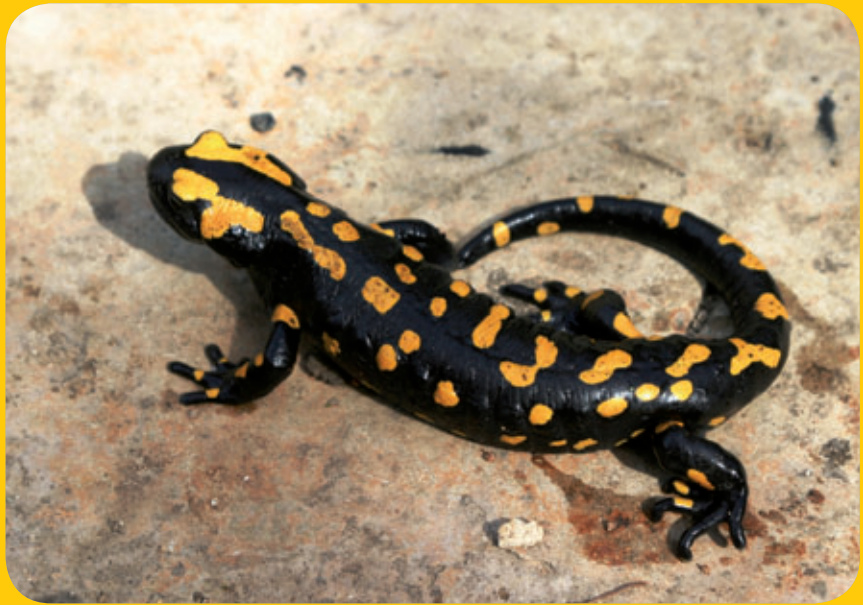
למנדרה בתומה בכרמל

גבע וארצי נוסעים לגן לאומי כרמל ומחפשים אחר אתרים של דוחיים. בואו להתפעל יחד איתם מהחורש הטבעי, מהצמחים המיוחדים ומהנוף היפה בהר הכרמל