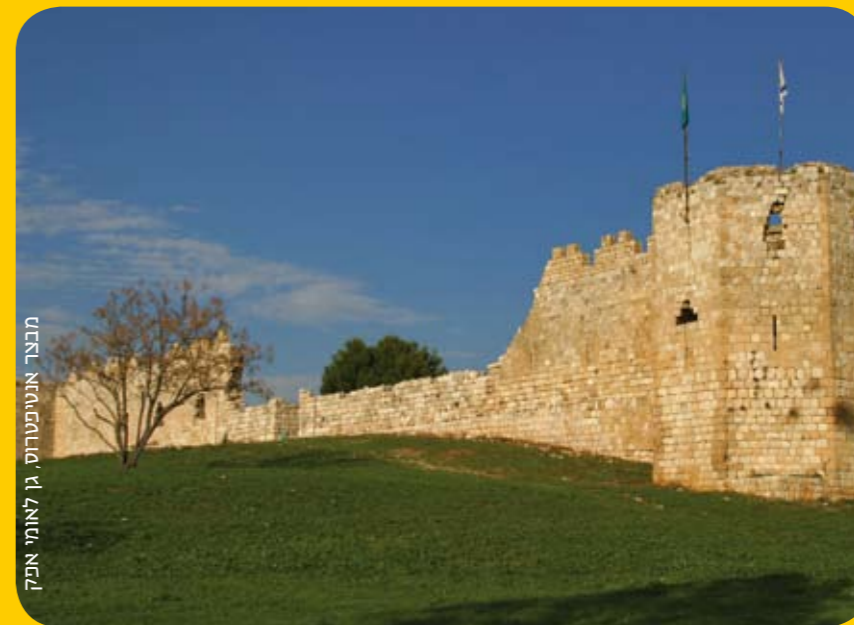
מבצר אנטטיפטריס, גן לאומי אפק

גבע וארצי נוסעים לגן לאומי ירקון ומתחקים אחר היסטוריה בת אלפי שנים. בואו להתפעל יחד איתם ממקור המים החשוב של אזור המרכז, מכרחי הנופר שפורחים על המים ומהדגים ובעלי הכנף המיוחדים שחיים בגן