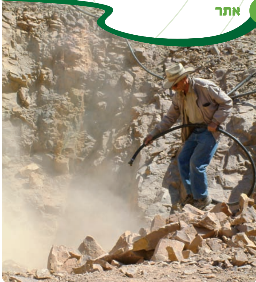
נקיו וחשיפת העורקים במהלך שיקום האתר.