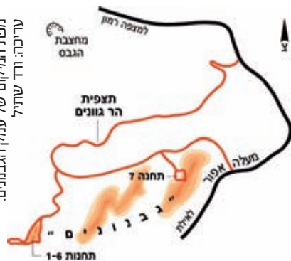
מפת המיקום של עמק הגבנונים. עריכה: רד שחיל

הר גוונים. העלייה בדרגת קושי בינונית. משם יורדים ברגל על השביל הרחב המשמש גם את רכבי ה-4x4 עד לחניון ומשם, כמו באפשרות הקודמת, הולכים לכיוון המסלול המעגלי המשולט ובו שש תחנות ועושים את המסלול בהתאם לשילוט, להוראות וללא עזיבת השביל. עם היציאה חזרה לחניון ממשיכים מזרחה בדרך רחבה עד לשביל המוביל לתחנה השביעית ומשם הליכה קצרה לתחנה וחזרה. מכאן ממשיכים מזרחה עד המפגש עם הרכב ויוצאים חזרה לכביש. סך כל ההליכה כ-5 ק"מ.