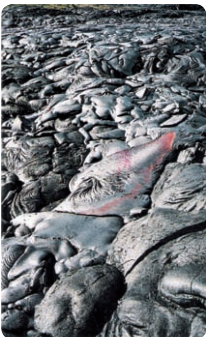
לבה עולה מהעומק חודמת בסדק בהר הגעש אתנה שבסיציליה.

ביוזמה משותפת של הקרן לשיקום מחצבות, רשות הטבע והגנים ויחידת המכרות של משרד התשתיות הלאומיות, החל מבצע גדול לחשיפת העורקים וניקויים, הצבת שילוט והפיכת האתר למוקד טיולים וסיורים. לאחר עבודה מאומצת של כל הגורמים, נחנך האתר במאי 2005, בטקס מרגש על הר גוונים, בתצפית המיוחדת שנבנתה שם עם השילוט הפנורמי.