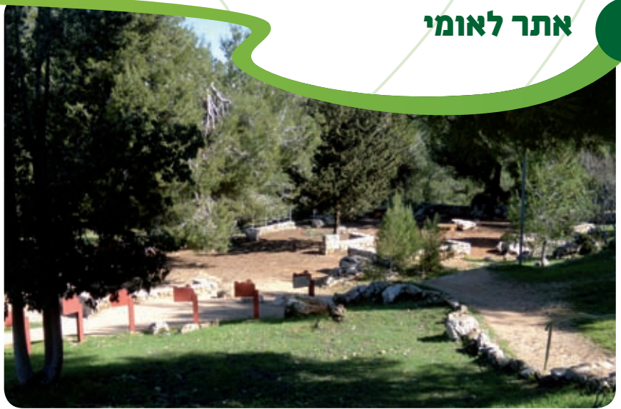
אזור הפיקניק בשולי ההר

לטרון, צובא, אבו גוש, עין חמד, שהפכו למוקדים פיאודליים חקלאיים המוחזקים על ידי אציל נחשב מקורב למלך או בידי אחד מהמסדרים כמו הטמפלרים או ההוספיטלרים או אחרים פחות ידועים. מבנה המאחז הצלבני מתאפיין בבנייה על פי שני צרכים שונים: טירה או מבצר. ייעודו ושימושו העיקרי של המבצר היה צבאי ושל הטירה - אזרחי. ההבחנה בולטת בהבדל שבין המבנה בעין חמד, שהיה מבנה לשימוש אזרחי חקלאי, לבין הקסטל, שהיה מבצר דרכים ותצפית.