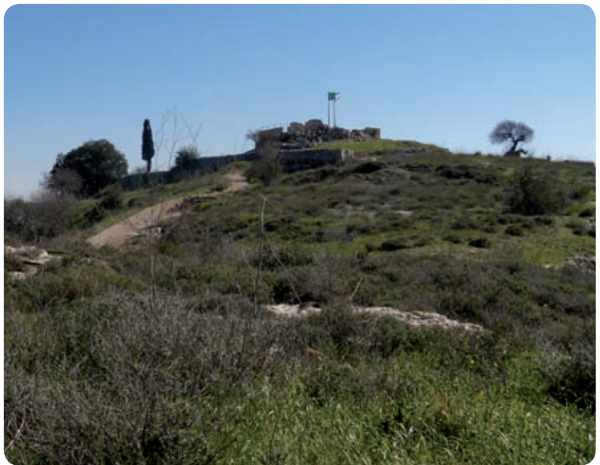
מבט כללי על ההר

סיפור הקסטל המרכזי הוא סיפור הקרבות של תש"ח לפריצת הדרך העולה