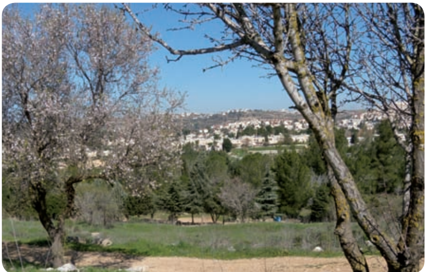
תצפית אל מבשרת ציון