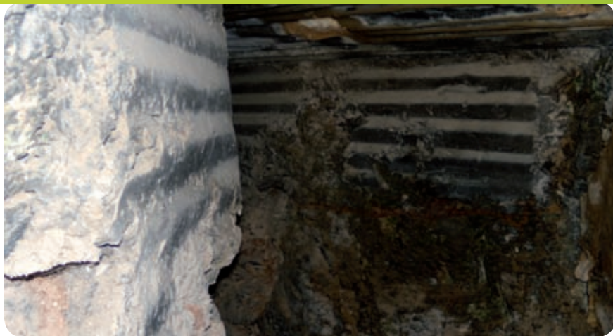
ביצורים על ההר

בשנת 1956 הגיע לארץ גל עלייה שני. תנופת הקליטה יוצרת מוקד חדש מצפון לכביש וליישוב הקיים שהופך גם הוא ליישוב הנושא את השם מבשרת ירושלים. ב-1964 מתאחדים שני היישובים תחת השם "מבשרת ציון". היישוב מתפתח במהירות, מפעיל מערכות חינוך משובחות וסביבה יישובית המושכת אליה רבים מירושלים ומכל הארץ. היישוב החדש מחובר לקסטל והקסטל הוא חלק מן היישוב שהופך לסמל ולאתר זיכרון לאומי.