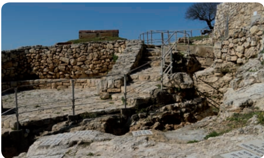
לוחות זיכרון לנופלים במבצר