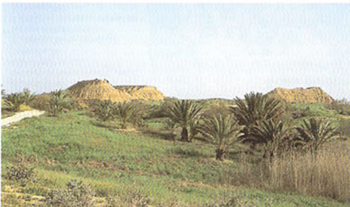
נוף מרחבי הלס

נחל הבשור עובר בגבול שבין ארץ המדבר (מדרום) - שם חיו אוכלוסיות נוודים, לבין הארץ הנושבת (מצפון) - שם איפשרה כמות הגשמים קיום חקלאות ויישובי קבע. לפיכך הוקמו בעת העתיקה ישובים רבים לאורך הנחל. ישובים אלה שימשו כקו הגנה ליושבי הארץ מפני נוודי המדבר שאיימו לפלוש לתוכה. קו זה עובר באזור פארק אשכול וניתן להבחין בו בשרידי היישוב תל שרוחן, הנמצא 3 ק"מ מדרום לשמורת הטבע נחל הבשור; בתל ג'מה, הנמצא בהמשך האפיק מצפון; ובתל עג'ול, שבשפך הנחל לים מדרום לעזה.