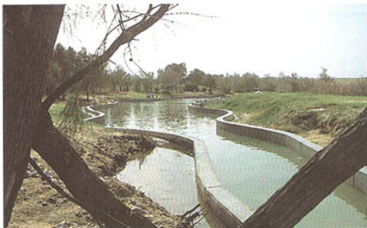
מעיינות עין הבשור - זרימה