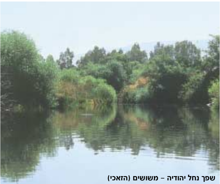
שפך נחל יהודיה – משושים (הזאכי)

הנחלים האחרים יצרו קרוב להישפכם לכנרת לגונות , תופעת טבע