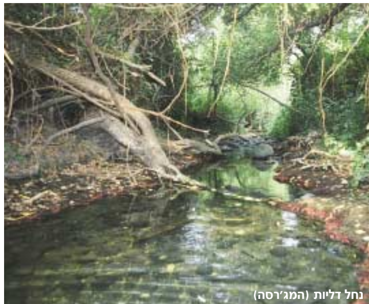
נחל דליות (המגר'סה)

לקראת אמצע המסלול מתרחב אפיק הנחל לברכות, שבהן ניתן