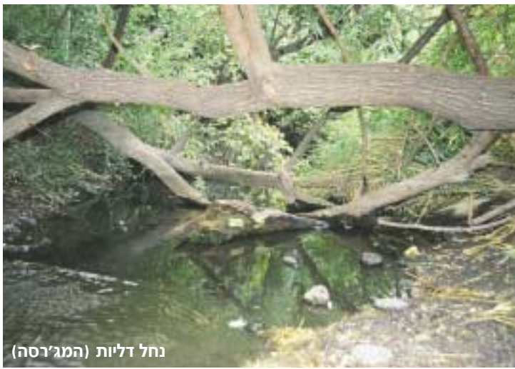
נחל דליות (המג'רסה)

לתיאום הדרכות בשמורת טבע הבטיחה אפשר ליצור קשר עם מרכז חינוך והסברה גולן, בטלפון: 04-6850664