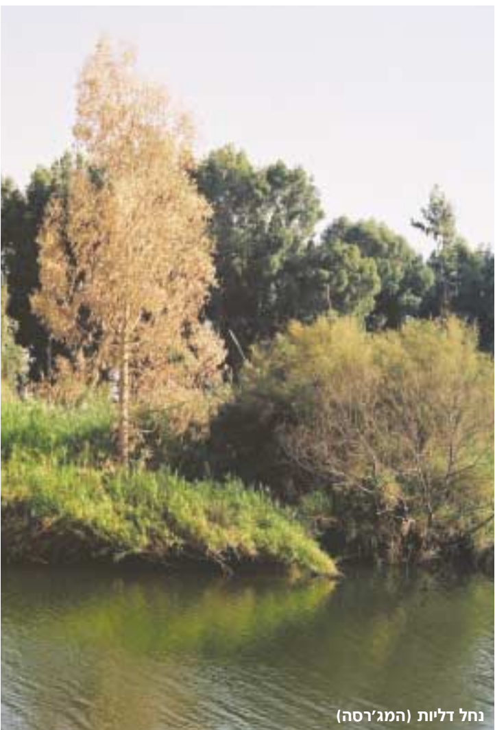
נחל דליות (המג'רסה)

בחלקה הצפון-מערבי נשפך אל הבקעה נהר הירדן, הנהר הגדול בארץ, שהוא גם מקור המים העיקרי של הכנרת. כמות המים שמזרים הירדן לכנרת בשנה, כ-500 מלמ"ק (מיליון מטר מעוקב), שווה פחות או יותר לכמות המים הנשאבת ממנה, שהם כשליש מ"המים של המדינה".