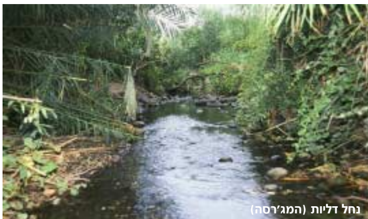
נחל דליות (המג'רסה)

בבקעת בית צידה, השוכנת בצפון-מזרח הכנרת, נופי מים מגוונים. זהו המקום היחיד בישראל שבו נשתמרו נופי ביצה טבעיים, כמעט בלתי מופרעים. נמצאים כאן פלגי מים הזורמים בכל ימות השנה ופלגים עונתיים, ברכות מים, מעיינות, שטחי הצפה ונטיגיה של הכנרת, ודלתא של הנהר הגדול בארץ, המפורסם בעולם כולו – הירדן.