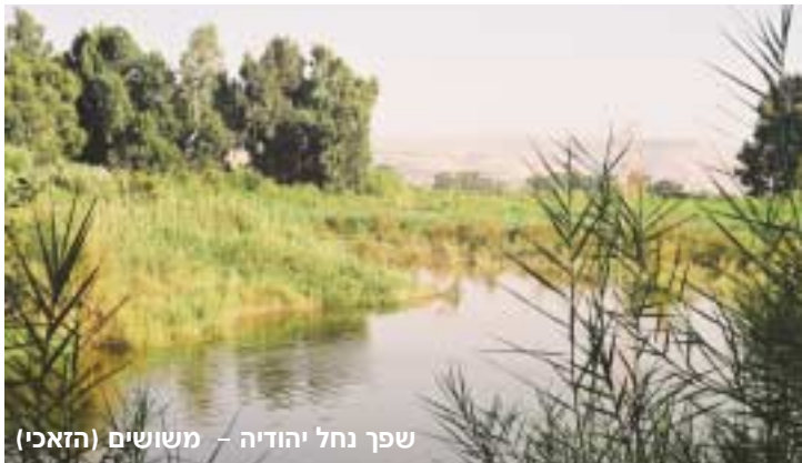
שפך נחל יהודיה – משושים (הזאכי)

היווצרות בקעת בית צידה היא תוצאה של תהליכים גיאולוגיים שהתרחשו בבקע הירדן וברמת הגולן מלפני 3 מיליון שנה ועד לפני 100,000 שנים. התהליכים הללו קשורים בשינוי כיוונו של קו השבר המזרחי של בקע הירדן באזור הכנרת. קו זה, שנמשך מצפון לדרום בצדה המזרחי של הכנרת, פונה לכיוון צפון-מזרח בקצה הצפוני שלה (שבר 'שיח' עלי"), ומנמיך את אזור יער יהודיה. על ידי כך מוטים נחלי מרכז הגולן – משושים – יהודיה, זוויתן ודליות ויוצרים מעין דלתא בהישפכם לכנרת ברצועת חוף קצרה של כ-5 ק"מ בלבד. באמצעות הסחף שסוחפים עמם הנחלים הם יוצרים את תשתית הבקעה.