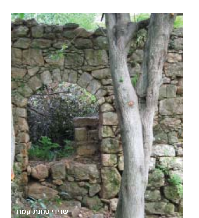
שרידי טחנת קמח

לעין יקים (מס' 4 במסלול). עתה יש להעפיל בשביל המסומן באדום, שבו התחלנו את טיולנו, למשטרת עין תינה (נקודה מס' 2) ולמבואת השמורה.