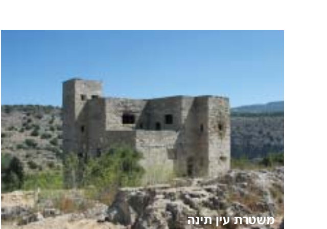
משטרת עין תינה

ממבנה המשטרה יורד השביל לעין יקים בגדה הדרומית של נחל מירון. בדרך הכשירה רשות הטבע והגנים ספסלים מאבן מקומית בצל עצי החורש. הספסלים יהיו שימושיים מאוד בדרך חזרה, במעלה השביל. לאורך השביל צומחים עצים בעלי עלים דמויי לב – עצי כליל החורש.