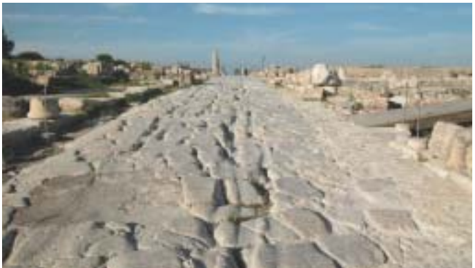
הקרוו וחריצים שהותירו בו גלגלי העגלות

בצדי הרחובות נמצאו זה לצד זה מבנים שונים. נחשפו כאן מבני ציבור רחבי-ידיים, בתי מרחץ ושרידיהם של בתי מגורים ומקוואות טהרה מן התקופה הרומית. בתקופה הביזנטית הוקמו כאן מבנים נוספים, חלקם על גבי שרידים מהתקופה הרומית, ביניהם שתי כנסיות הסמוכות אל הצטלבות רחובות העמודים, אחת ממערב ושנייה ממזרח, בית "חג הנילוס" (להלן, מס' 6). בתי מגורים (שאחד מהם אף רוצף בפסיפסים) ומבני תעשייה אחדים. במהלך התקופה הביזנטית שופצו חלק מן הרחובות. השיפוץ החשוב שבהם הוא זה של מפגש רחובות-העמודים, שבוצע בזמנו של הבישוף אוטרופיוס, אב-הכנסייה של העיר. מאורע זה הונצח בכתובות יווניות, ששולבו בעיטורים ברצפות הסטווים.