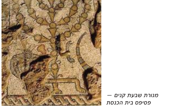
מנורת שבעת קנים – פסיפס בית הכנסת

שילוט מפורט מבאר את הסצנות המתוארות ברצפת הפסיפס.