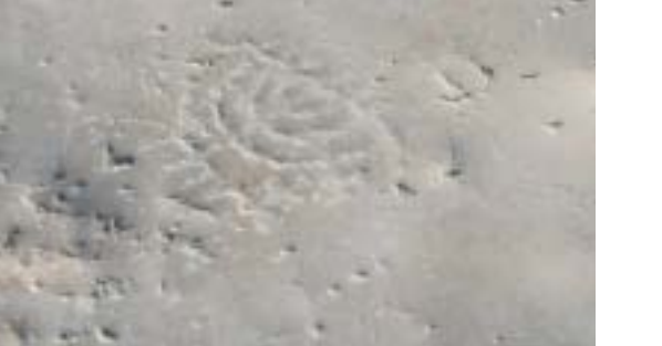
מנורת שבעת קנים חקוקה על גבי אחת ממרצפות ה"קרדו"

מחקר וכתביה: פרופ' זאב וייס וד"ר צביקה צוק;