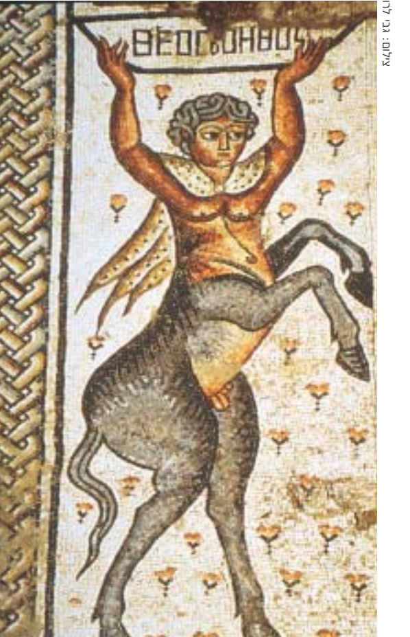
הקנטור בבית "חג הנילוס"