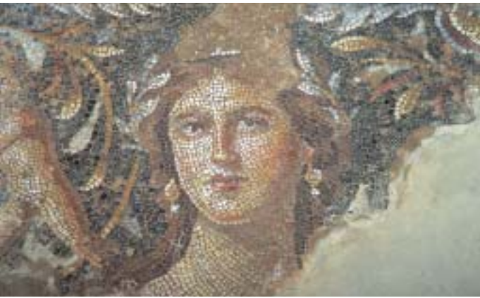
דמות האישה היפה בפסיפס בבית דיוניסוס

החפירות הראשונות באתר נערכו בשנת 1931 בידי ל' ווטרמן מאוניברסיטת מישיגן שבארצות הברית. סקר אמות המים ומחקרן החל בשנת 1975 בידי משלחת מאוניברסיטת תל אביב בניהולו של צ' זוק. המשלחת חפרה את מאגר המים העתיק (1) בשנים 1993–1994. פעולות מחקר וחפירה בציפורי חודשו בשנת 1983 בידי משלחת מאוניברסיטת טמפה בפלורידה,