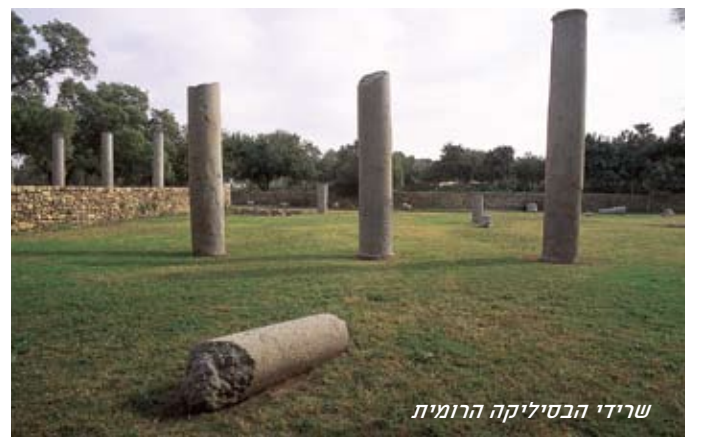
שרידי הבסיליקה הרומית

החפירות הראשונות באשקלון נערכו בשנים 1921-1922 על ידי פרופ' גרסטנג, שחשף את הבסיליקה הרומית. מאז שנת 1985 חופרת בתל אשקלון משלחת ארכיאולוגית בראשותו של פרופ' לורנס סטייגר מאוניברסיטת הרווארד.