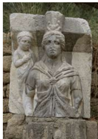
פסל איסיס-אלה מצרית

באר זו ובארות נוספות שימשו את החקלאים של הכפר הערבי ג'ורה ששכן במקום (מצדו המזרחי של הגן הלאומי) בתקופה העות'מאנית. באר זו עברה תהליך שימור חלקי.