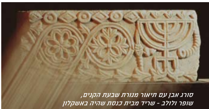
סורג אבן עם תיאור מנורת שבעת הקנים, שופר ולולב - שריד מבית כנסת שהיה באשקלון

לא ברור מתי התחדשה התיישבות היהודים באשקלון, ולפי הממצאים נראה כי בתקופה הביזאנטית, בין המאות 4-7 לסה"ג התקיימה קהילה יהודית בעיר. מבין הממצאים המצביעים על יישוב יהודי באשקלון נציין: שתי כתובות הקדשה של בית כנסת ' האחת על עמוד אבן והשנייה על סורג אבן. כמו כן נמצא סורג אבן מבית כנסת ללא כתובת ועליו חקוקים מנורת שבעת קנים, שופר ולולב; שתי כתובות נוספות שמקורן כנראה במבנה בית הכנסת – כתובת שבה רשימת כ"ד משמרות הכהנים וכתובת הקדשה בארמית; בסיס של עמוד שיש, שמקורו בבית כנסת מהמאה ה-4 לסה"ג, שעליו חקוקים מנורת שבעת הקנים, שופר ואתרוג. לא ניתן לראות דבר משרידי אלה בשטח הגן הלאומי.