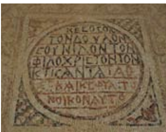
הכתובת המרכזית בכנסייה המערבית

בשנת 1956 התקיימה במקום חפירת בדיקה בראשות הארכיאולוג ש' אפלבוט, מטעם האוניברסיטה העברית בירושלים. בשנים 1956-1957 נערכו חפירות נרחבות בניהול הארכיאולוג א' נגב, מטעם האוניברסיטה העברית בירושלים ורשות הגנים הלאומיים. חפירותיו ומחקריו של פרופ' נגב באתרים נבטיים בנגב חשפו את היסודות להכרת עולמם של הנבטים וערי הנגב. בשנת 1989 חודשו החפירות בידי א' נגב ולאחר מכן בשנים 1993 ו-1994 בידי ט' אריקסון-גיני מטעם רשות העתיקות. בחפירות אלו נחשף מבנה קדום (אֵאֵא) מתחת לבניין המשטרה, שנבנה במאה השנייה לסה"נ והיה בשימוש עד לרעש האדמה של 363 לסה"נ. בנוסף נחשפו מבנים מראשית היישוב בממשית מהמאה הראשונה לסה"נ, שנהרסו בכדי לבנות את בניין ווא (מס' 10 במפה) במחצית השנייה של המאה השנייה לסה"נ.