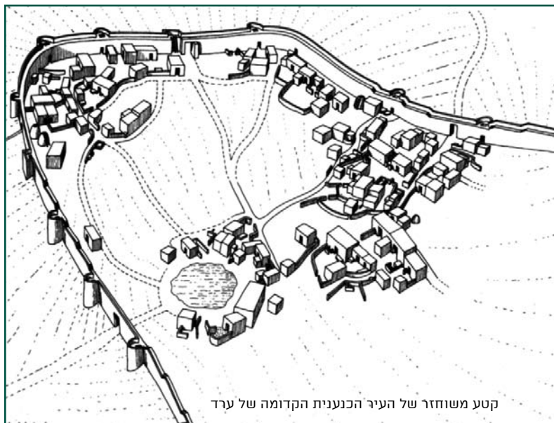
קטע משוחזר של העיר הכנענית הקדומה של ערד

בממצאי החפירות בולט היעדרם של שרידי יישוב משלהי תקופת הברונזה המאוחרת, היא תקופת הכיבוש הישראלי וההתנחלות. ואכן, המקום ניטש ולא נושב למשך כ-1500 שנה.