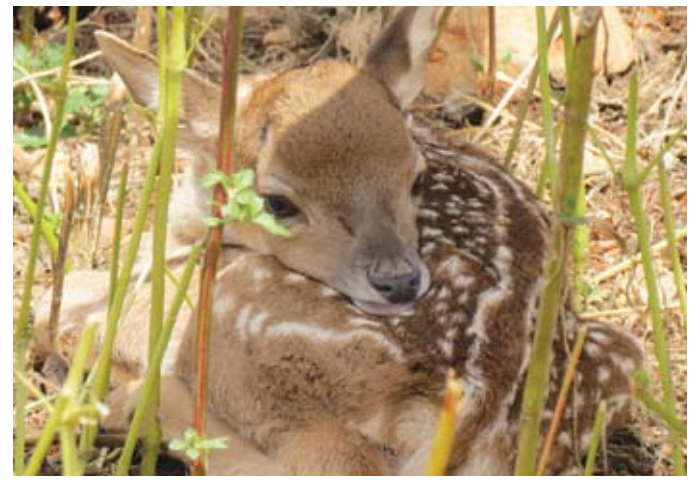
עופר של יחמור פרסי

יחמור פרסי: היחמור התקיים בארץ עד לפני כמאתיים שנה. שרידי עצמות וקרניים של יחמורים נמצאו בחפירות ארכיאולוגיות שתיעדו שכבות מאז התקופות הפרהיסטוריות. במקרא נכתב שבשר יחמור עלה על שולחנו של שלמה המלך (מלכים א' ה' 3). בשנת 1888 צפה הכומר חוקר הטבע הנרי בייקר טריסטראם ביחמורים בגליל התחתון, ובשנת 1925 נמכרו בשוקי ירושלים קרני יחמורים שהובאו, כנראה, מירדן. קרני היחמורים, כמו קרני האיילים, מסועפות. הן נושרות וצומחות מחדש מדי שנה בשנה.