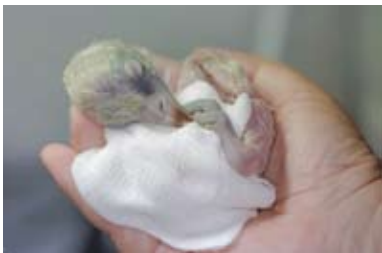
גוזל נשר לאחר בקיעה במדגרה, בסיוע המטפל

בעבר היו אוכלי הנבלות ניזונים מחיות בר וחיות משק שגודלו בארצנו. לפיכך רשות הטבע והגנים משתפת פעולה עם מגדלים שתורמים לתחנת ההאכלה פגרים של חיות משק, ומסייעים בכך לקיומה של קהילת נשרים משגשגת בכרמל.