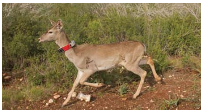
השבה לטבע - נקבת יחמור פרסי (עונדת משדר לצורך מעקב)

היחמור הפרסי הוא מין שנכחד מהטבע בעולם וגדל כיום רק בגני חיות ובחי-בר כרמל, ובישראל הושב לטבע. ראשוני היחמורים הובאו לארץ במבצע מיוחד במהלך ההפיכה האסלאמית (1978), במטוס אל-על האחרון שעזב את אירן. לחי-בר כרמל הובאו ארבע נקבות מאירן וזכר אחד מגרמניה. מאז ועד היום המליטו הם וצאצאיהם מאות יחמורים. כאשר נוצר גרעין רבייה גדול מספיק שוחררו יחמורים לטבע, תחילה בנחל כזיב (1996) ובהמשך בנחל שורק ובמקומות אחרים. ליחמורים נודעת חשיבות רבה במערכת האקולוגית הים-תיכונית, וכאוכלי עלים יכולים לסייע במיתון הפוטנציאל להתפשטות של שרפות חורש.