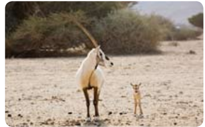
ראם וגורו בחי - בר יעבתה