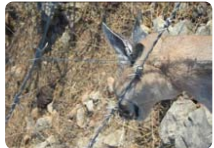
קרקל במלכודת שהניחו תאילנדים

דרגות הקושי ועוד. בנוסף החלו אנשי הפרויקט בתכנון של המקטע הצפוני ביותר שבין החרמון לעמק חולה והמקטע הדרומי ביותר שבין אילת למעלה שחרות.