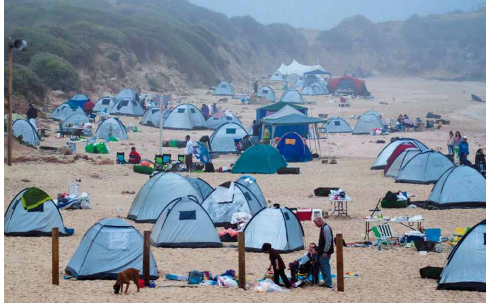
גן לאומי חוף פלמחים

גן לאומי חוף פלמחים: ים כמו פעם אם כל חופי הארץ היו נראים כך. זו אחת המחשבות הראשונות העולות בראש כאשר פוגשים לראשונה בחוף הבתולי הזה, שהליכה בו נדמית לעתים למסע בזמן, אל הימים