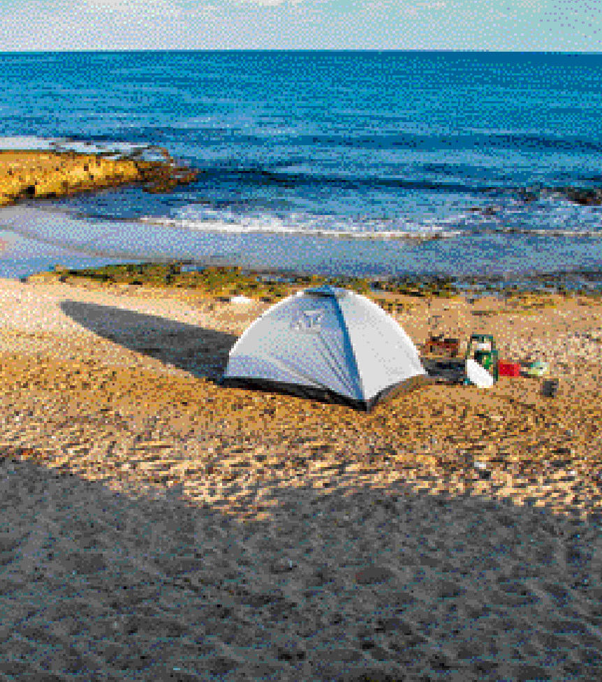
גן לאומי אכזיב

אסור להשמיע בחניון הלילה מוזיקה ולהכניס אליו גנרטורים. כאן תשמעו את גלי הים ואולי גם את פצפוצי העץ המתכלה לאטו בקומזיץ סמוך. יש פה שולחנות פיקניק, מקלחות חוף, ברזי מים, מרכז שירות למטייל ונקודות הבערת אש במקומות ייעודיים