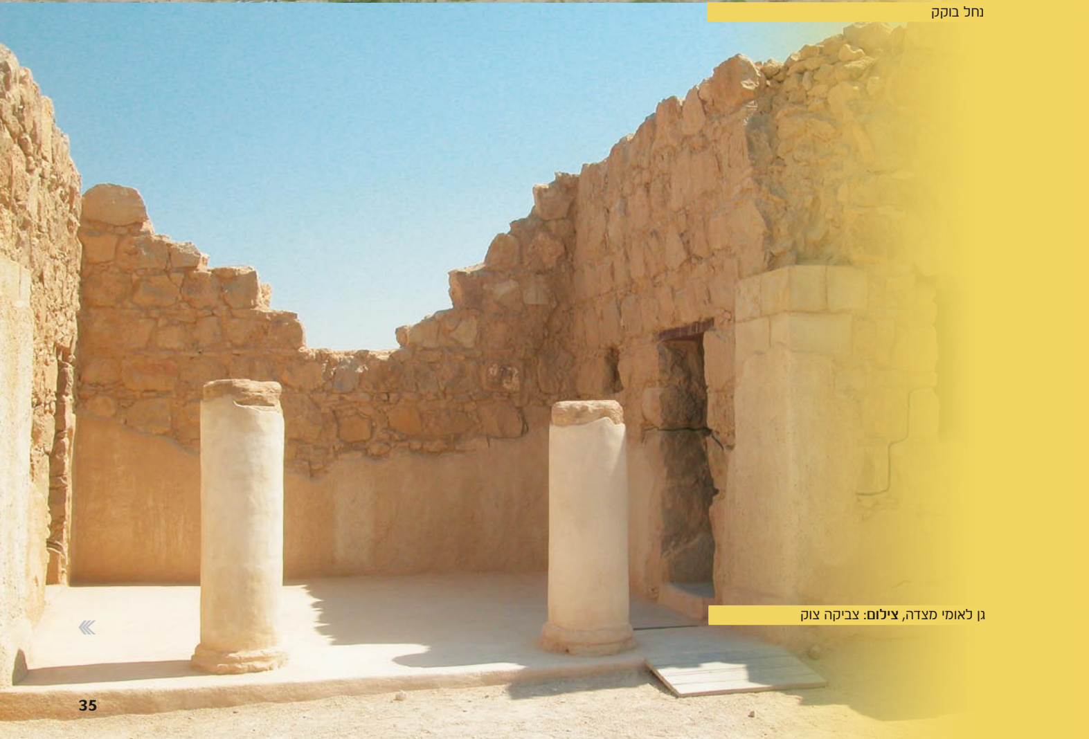
גן לאומי מצדה