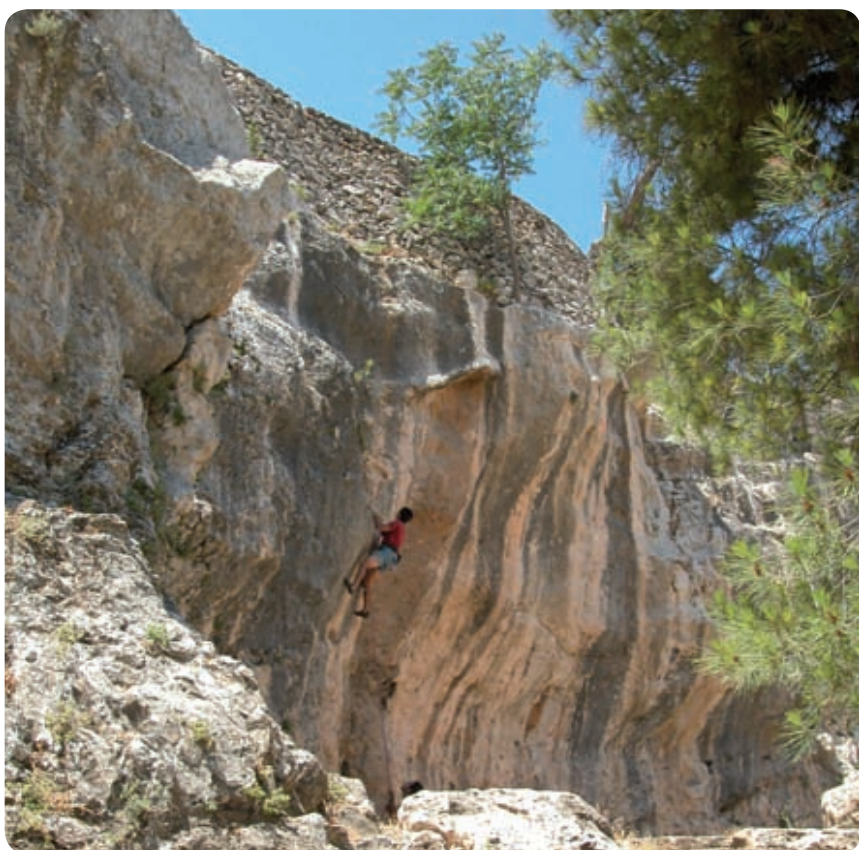
טיפוס מצוקים בגיא בן הינום

השביל יורד לגיא בגרם מדרגות עתיק, כאן אפשר לסטות מהשביל ולעלות