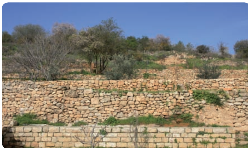
טרסות משוחזרות בגן לאומי עינות תלם

יורדים במקביל לגדר הצפונית של חוות טור סיני לדרך עפר המובילה לערוץ נחל שורק וממשיכים לגן לאומי עינות תלם. שולחן הפיקניק בצל עצי התאנה שבחצר בית החווה הישן, הטרסות המשוחזרות ומי המעיינות הקטנים הזורמים לבריכות יוצרים יופי של מקום להפסקה ולמנוחה. מכאן ממשיכים בגדה הימנית של נחל שורק, חולפים על פני פתחת נחל חלילים, ממשיכים במורד נחל שורק ומגיעים לכביש העולה למבשרת ירושלים. התנועה כאן רבה יחסית. יש לחצות את הכביש בזהירות רבה, לדלג מעל מעקה ההפרדה ולהמשיך במורד נחל שורק. עד מהרה השביל מגיע