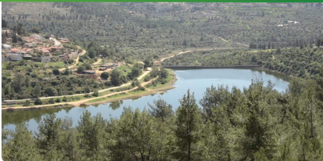
מאגר בית זית בחורף

של עצי פרי ומדרגות שלחין יפות. שביל מדרגות יורד בין עצי השקד למעיין (היבש בדרך כלל).