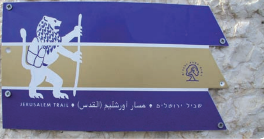
סימון שביל ירושלים

המצבות האחידות, המאורגנות בשתי שורות, מעידות על הניסיון ליצור חברה שוויונית בקרב חברי הקהילה.