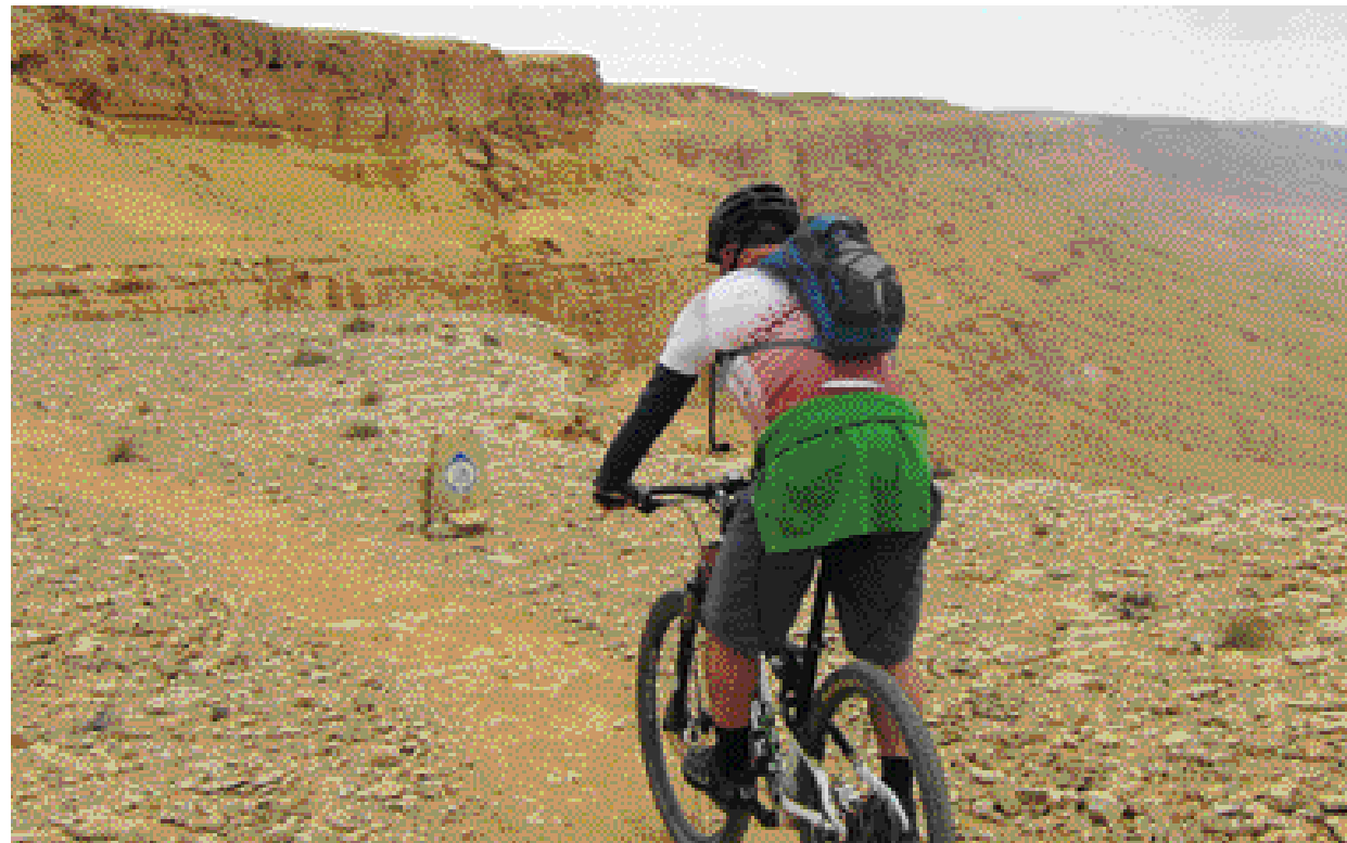
38 קילומטר של נופי מדבר מרהיבים.

לרכוב אל מול נוף קדומים יפהפה, בין מצוקים והרים צבעוניים, לפגוש בחי ובצומח ייחודיים ומרתקים ובעיקר ליהנות משלווה מדברית. מדושים בשביל ישראל לאופניים ממצפה רמון לחאן בארות