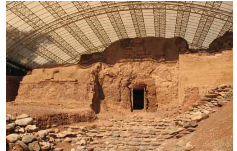
השער הכנעני בתל דן