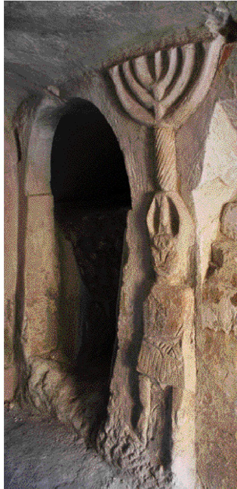
ביקור במערות המנוחה בבית שערים

בשמורת הטבע גמלא מתקיים שילוב נדיר של טבע ונוף עם סיפור אנושי היסטורי מרתק. המצפור צופה אל מושבת קינון של עופות דורסים, ובמרחק הליכה ממנו, בראש קניוני הנחלים המרשימים, מצויים שרידיה של העיר העתיקה גמלא, ובהם שרידי בית הכנסת הקדום ביותר בעולם, המספרים את סיפור גבורתה הייחודי. אל העיר העתיקה יורד שביל תלול, והגישה אליו התאפשרה עד כה רק למיטיבי לכת. בשנה האחרונה, כדי לאפשר