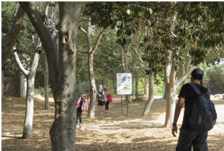
שביל החצבים בגן לאומי ירקון

ישוב יהודי חשוב, מקום מושבם של הסנהדרין ו"רבי" - הוא רבי יהודה הנשיא שעמד בראשה. לאחר מותו נקבר "רבי" בבית שערים ויהודים רבים ביקשו להיקבר לידו. כך הפך בית שערים ל"נקרופוליס" - עיר מתים. הסיור בגן הלאומי כולל ביקור בתוך מערות הקבורה הרבות, המעוטות ביצירות נדירות. לפני כמה שנים הוכשר באתר שביל טיול המוביל למתחם ביקור נוסף - "מערות המנורה". המתחם כולל שש מערות קבורה עשירות בעיטורים, בכתובות ובתבליטים, בהם עשרות תבליטים של מנורות שבעת הקנים, שהייתה לסמל המדינה. הביקור במערות המנורה נעשה בליווי מדריך מרשות הטבע והגנים. מועדי הסיורים מתפרסמים באתר האינטרנט של הרשות.