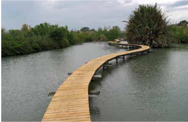
שמורת טבע עין אפק - גן מקלט לצמחים נדירים