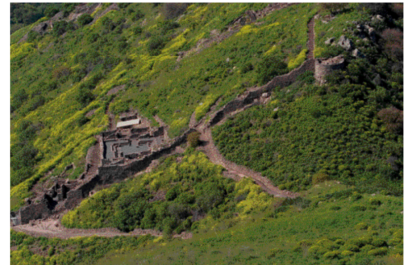
שביל לאוטובוסים עד לשרידי העיר העתיקה בגמלא