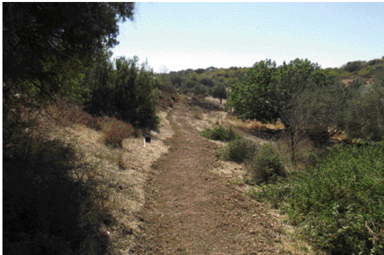
ה"שבינגל" - שביל האופניים בבית גוברין