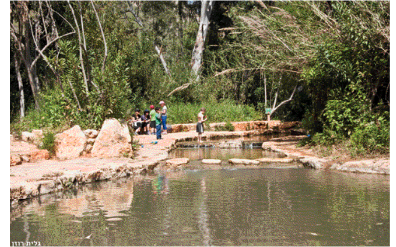
בריכות שכשוך בנחל עיון