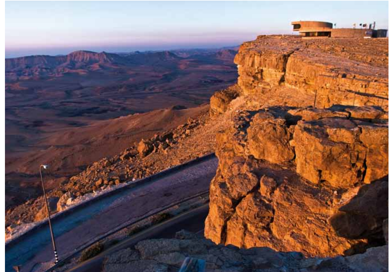
מרכז מבקרים מחודש במצפה רמון

מתקופת מרד בר כוכבא. בשנים האחרונות, לאחר גילוי קברו המפואר של הורדוס, נפרץ באתר שביל המשך המוביל מבורות המים והמחילות התת קרקעיות אל שרידי התיאטרון ואל קברו של הורדוס.