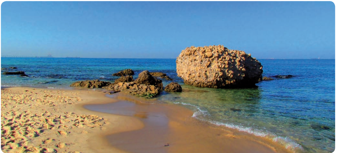
חוף הסלע גן לאומי אשקלון, שרידי חומת העיר.

ההתחייבות ותהיו זכאים לקבל את תג פקחים צעירים. אפשר לרכוש את החוברת תמורת 10 שקלים בקופת האתר, או להוריד אותה מאתר האינטרנט של רשות הטבע והגנים - ללא תשלום.