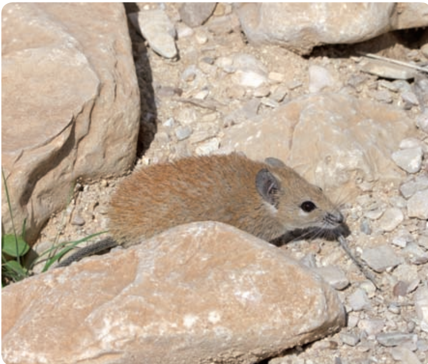
קוצן זהוב - אוסף חלזונות ו"שותה" את תוכנם.