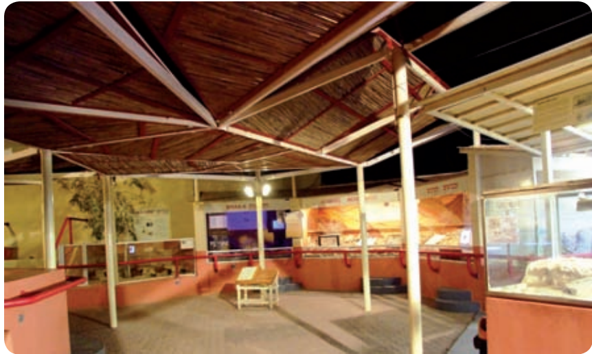
מוזיאון חי רמון - הצצה למגוון בעלי החיים הקטנים של הנגב.