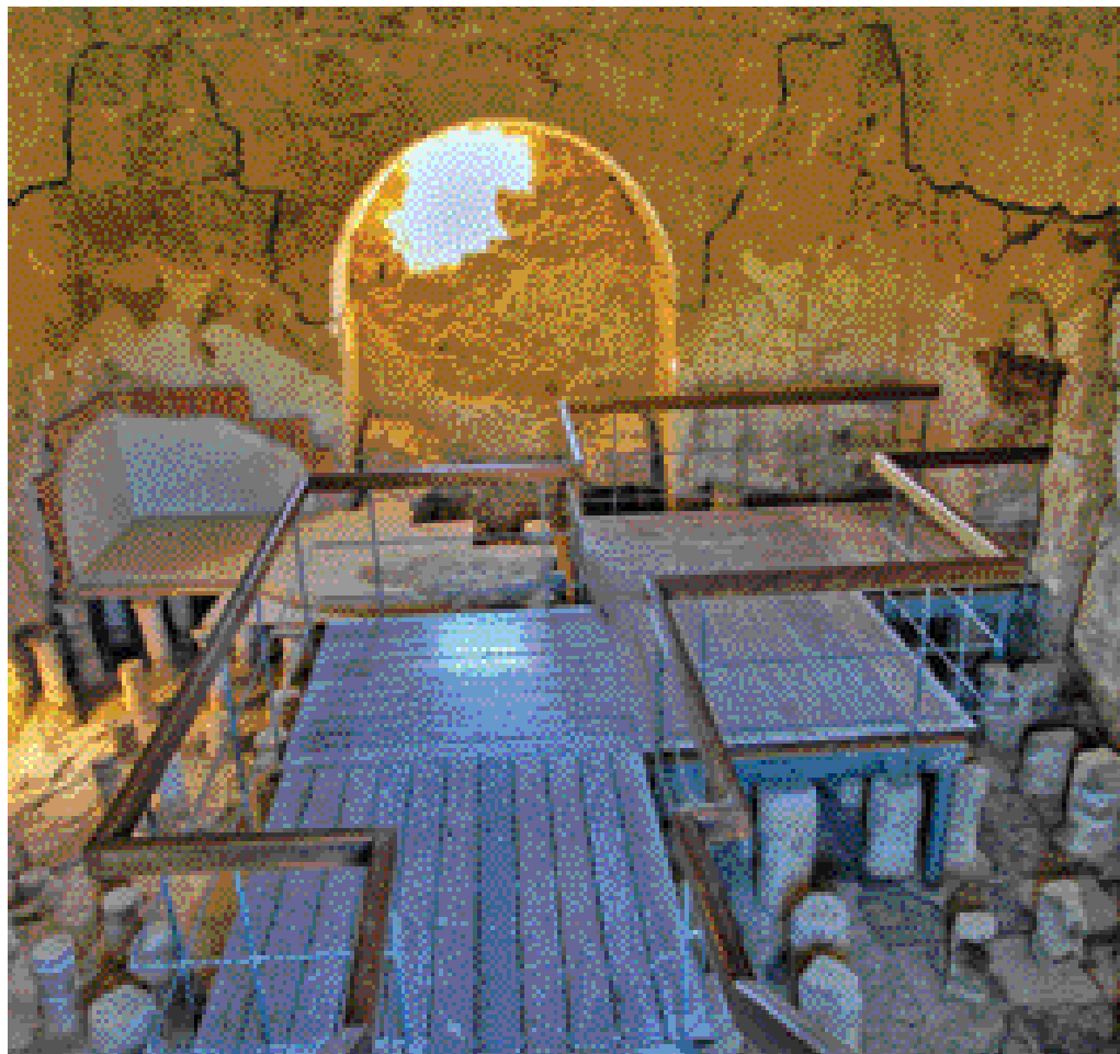
בתמונה למעלה: מבט על מצדה ממזרח. למטה: שחזור של בליסטרה רומית (מימין) ובית מרחץ גדול מתקופת הורדוס