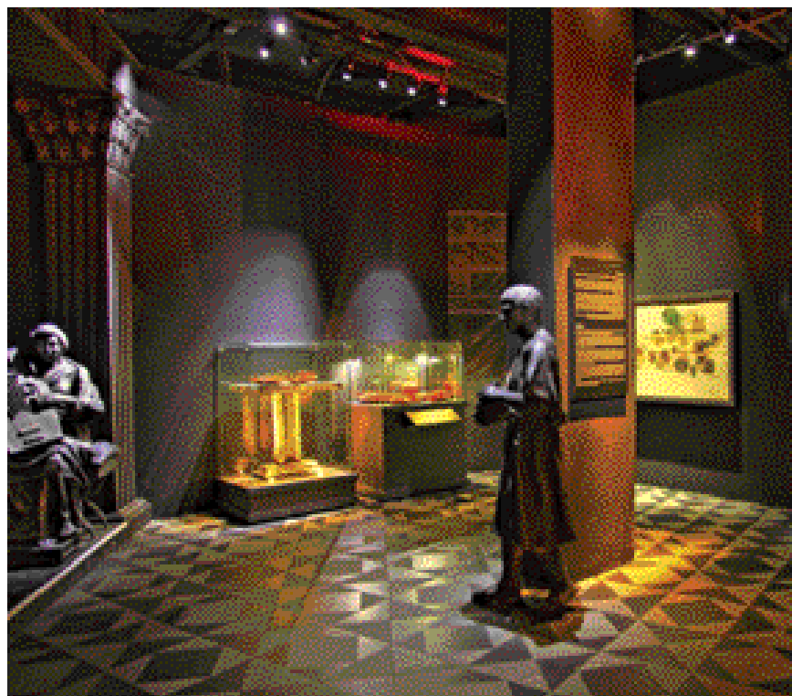
מוזיאון מצדה ע"ש פרופ' יגאל ידין מציג יותר מ-900 פריטים

הכותב הוא איש המכון לארכיאולוגיה של האוניברסיטה העברית ירושלים ומנהל משלחת חפירות מצדה