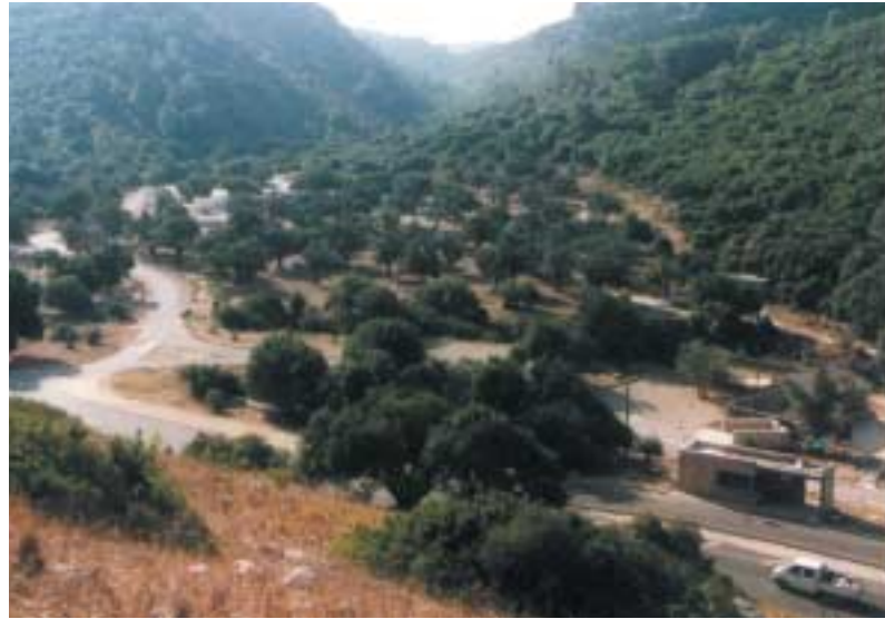
גן לאומי הכרמל

הראשונים ראו את האדם במרכז, האחרונים ראו את הטבע.