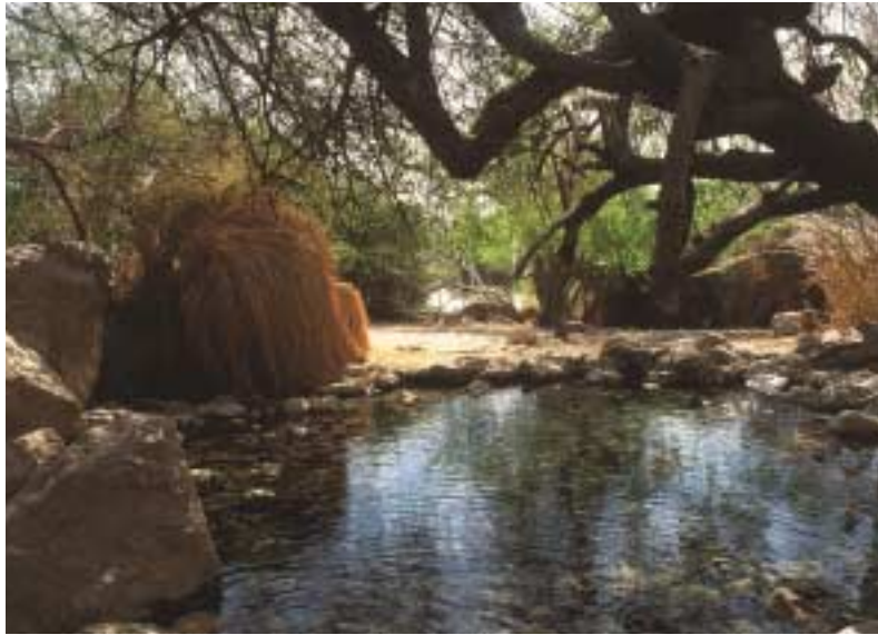
שמורת טבע עין גדי

לכדי גוף אחד והפכו ל"רשות הטבע והגנים", כפי שאנו מכירים אותה כיום, עם 319 שמורות טבע ששטחן הכולל הוא 5,019,233 דונם ו-116 גנים לאומיים בשטח כולל של 247,336 דונם - הישג בהחלט לא מבוטל.