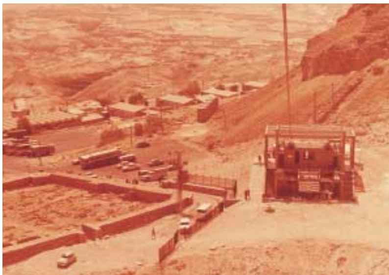
המחנה הרומי, מצדה