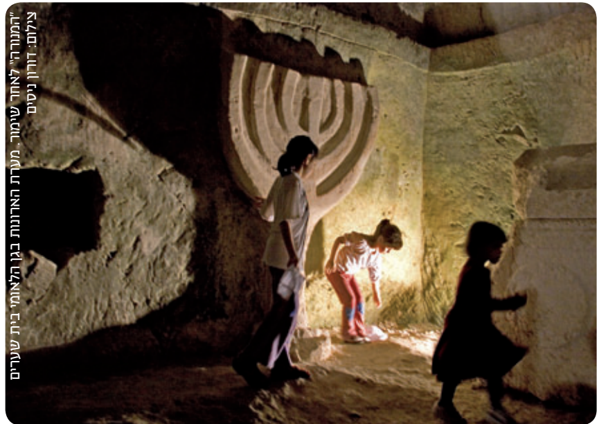
"המנורה" לאחר שימור. מערת הארונות בגן הלאומי בית שערים

התגליות הארכיאולוגיות המרשימות פתחו בפני החוקרים צוהר נרחב לתקופת המשנה והתלמוד. כאן, באזור הגליל התחתון המערבי, במדרונות הגבעות העשויות סלע קרטוני רך, חצבו תושבי בית שערים העתיקה בכישרון אמנותי