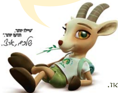
טיילו יותר, חזרו יותר! שאפי, אילי.

תשובות: וברוד, יוצמ לעוש, יבצ, יבונ לעי, עובצ, באז.