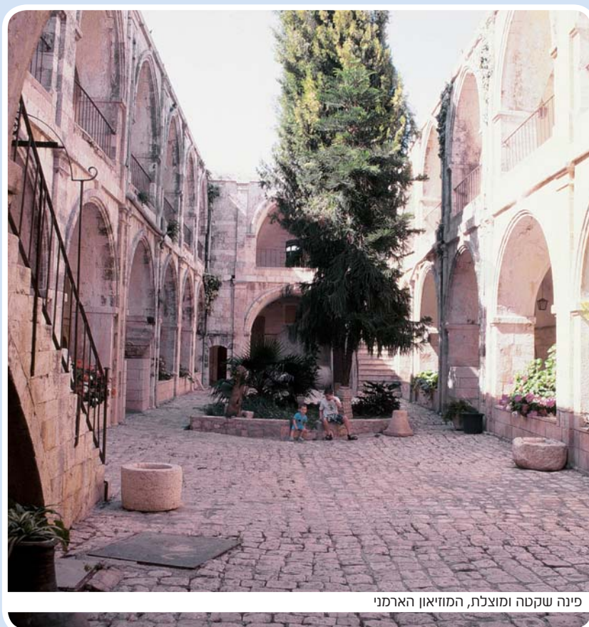
פינה שקטה ומוצללת, המוזיאון הארמני

הזכוכית במגדל דוד ביקרו לא פחות ממיליון ו־300 אלף ישראלים! שיא לכל הדעות.