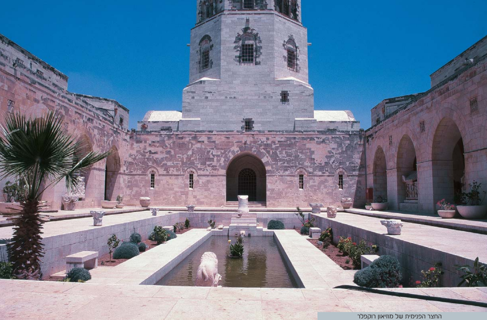
החצר הפנימית של מוזיאון רוקפלר

עובר בסמטאות צרות שלאורכן דוכנים אינ'ספור. בין חנויות המזכרות הרבות, מתחבאות מסעדות פועלים קטנות, לצד חנויות ממתקים עתירי קלוריות וריחות טיגון של כדורי הפלאפל הירושלמי הענקיים. מרחוב בית הבד נוכל לבחור בין שתי דרכים. באחת, נפנה דרך הרובע הנוצרי, רחוב שוק הצבעים ושוק המוריסטן הצבעוניים, כשביניהם נוכל לבקר בכנסיית הקבר – המקום הקדוש ביותר לנוצרים שהשליטה עליו היתה העילה הרשמית למסעות הצלב ולמלחמות שבאו בעקבותיהם.