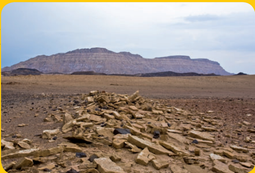
כתיבה: אלישבע קופלוביץ'

ה שבע הייתה לנו שמחה משפחתית בבאר שבע. ההורים אמרו שאם כבר הגענו עד