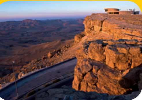
מרכז המבקרים במצפה רמון