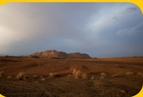
הר ארדון במכתש רמון

בצפון מזרח, בקעת מחמל בצפון ומכתש רמון במזרח. "הר ארדון הנראה בצפון הוא 'היפוך תבליט'", אמר ארצי והסביר שלמעשה הר ארדון היה פעם עמק בין שני הרים גבוהים ובפעילות הגיאולוגית, שכבר הסברנו עליה, ההרים נשחקו עד שנהפכו לשתי בקעות ובאמצע נשאר הר. התחיל לרדת ערב וחזרנו לרכב. אירועי היום עניינו וריגשו אותי. בדרך הארוכה חזרה הביתה, חלמתי שאני פקח שיוצא למשימה מיוחדת להצלת חיות הבר, ושכל הנגב מתעורר לחיים בעקבות חזרתו.