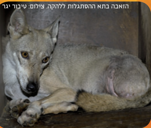
הזאבה בתא ההסתגלות ללהקה.