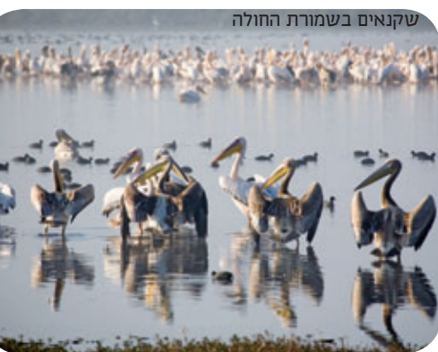
שקנאים בשמורת החולה