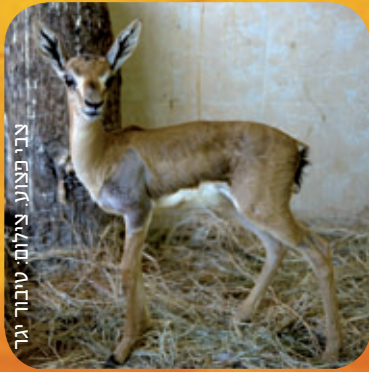
צבי תצנע.