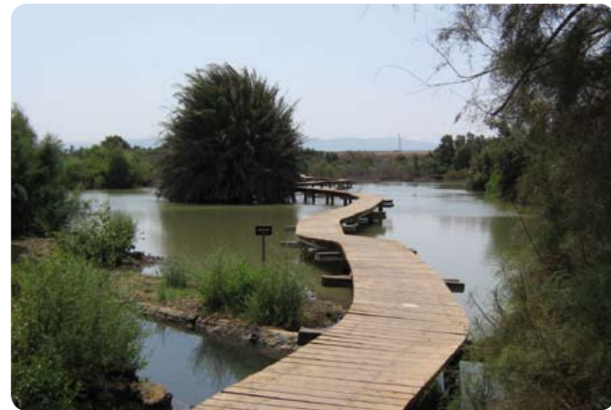
עין אפק, הגשר הצף.