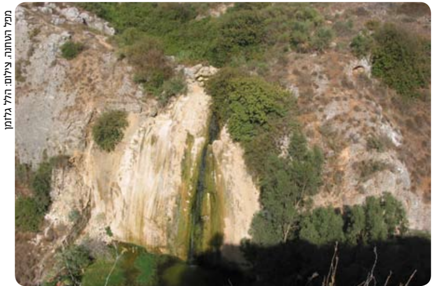
מפל הטונה.

נחל עיון הקניוני חוצב את דרכו העקלקלה במסלע קשה בין בקעת מרג' עיון ובין עמק החולה, והוא מרהיב ביופיו בעיקר בחודשי החורף, אז הוא נמצא בשיא זרימתו. המסלול שאנו מציעים נחשב לקל ונוח