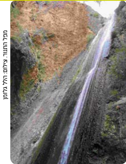
מפל התנור.

נמשיך הלאה, אל חלקו הקניוני ביותר של הערוץ, ונגיע למפל האשד. מכאן השביל מטפס על כתף הנחל ועובר בסמוך לבית הקברות של המושבה. השטח הפתוח שבו נצעד מכונה "גבעת החצבים" על שום הפריחה היפה של החצבים הפורחים בו בסתיו. מדרום אפשר להבחין במורדותיו של תל אבל בית מעכה, המוכר אך הוא ממקורות יהודיים ולא פעם נקשר בתנ"ך עם סיפורי קרבות ומרידות. מכאן יש תצפית מרהיבה על מפל התנור, שהוא הגבוה והמרשים מבין ארבעת המפלים בשמורה. שמו ניתן לו עקב היותו סגור בחלקו העליון כמו ארובה של תנור בישול מקומי (טאבון). אחרים יאמרו שצורתו היא כ"תנורה", כינויה של החצאית הערבית המסורתית. מתחת למפל בריכות המשמשות כבית נאמן לדגי הנחל ולשאר מיני רכיכות.