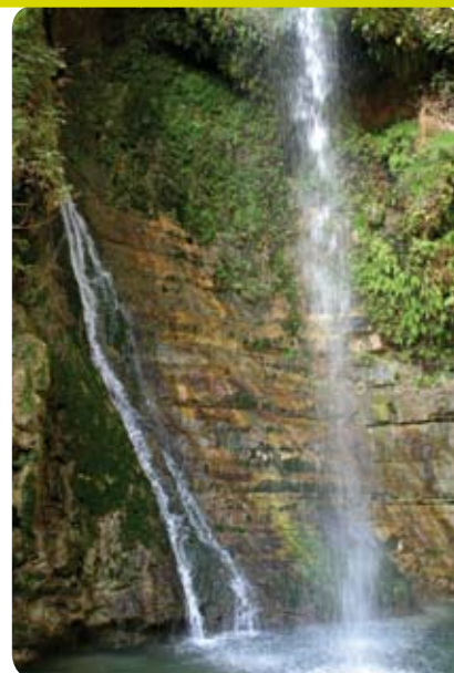
שמורת טבע עין גדי

כתוצאה מחשיפת אופק מי תהום במקום בו מתחתר המפל. חלקו העליון של המפל בנוי מסלע גיר, דרכו מחלחלים המים, ואילו בבסיסו יש שכבת חרסית אטומה למים, שעליה זורם אפיק מי התהום עד לחשיפתו במפל. במקום הנביעה נבנתה שוקת מאבן לצורך אגירת המים, בטרם יחלחלו שוב באדמת הסחף של הנחל ולא יהיו נגישים לבעלי חיים. השוקת נבנתה לראשונה על ידי הבריטים בתקופת המנדט, אז שימשה גם את עדרי הצאן של הבדואים שהיו באזור. בהמשך היא נהרסה בשיטפונות ונבנתה מחדש ביוזמת אנשי בית ספר שדה אילת בשנות השישים. מי המעיין מהווים מוקד משיכה לבעלי חיים רבים, ביניהם יעלים, שפני סלע ועופות שונים. עם קצת מזל, אפשר לצפות בהם, אך יש לזכור שזכותם של בעלי החיים למי המעיין היא ראשונה, לכן יש להמתין בסבלנות ובשקט עד שהם יסיימו לשתות ורק אז לרדת אל המעיין. איך מגיעים? יוצאים מאילת מערבה לכיוון בקעת עובדה, מהכביש העוקף את אילת ממערב או מדרך הגיא העולה בשולי נחל שחמון (מצפון לשכונת שחמון באילת). עולים בכביש מס' 12 מאילת לכיוון בקעת עובדה ונוסעים כשבעה קילומטרים עד לפנייה משולטת ימינה. דרך העפר המובילה מהכביש אל המעיין מיועדת רק לרכבי 4x4, לכן אם אין ברשותכם רכב כזה תיאלצו להחנות את רכבכם בצד הכביש ולהמשיך ברגל. המסלול מסומן בצבע שחור ומגיע עד לראש המפל. משם יורדים למעיין בסדק בעזרת יתדות. חוזרים אל הרכב במסלול המסומן בירוק, שעולה בהמשך הנחל ומתחבר לשביל שחור שיחזיר אתכם לכביש (לבעלי רכב 4x4 יש גישה עם הרכב עד לראש המפל. ממשיכים ברגל כמפורט). משך המסלול כשעה וחצי והוא מומלץ לכל המשפחה. מכאן מומלץ להמשיך אל שמורת חי-בר יטבתה. החי-בר נמצא בערבה הדרומית ליד קיבוץ יטבתה.