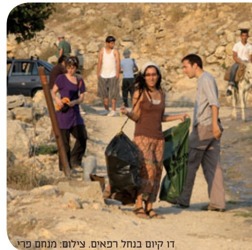
דו קיום בנחל רפאים.