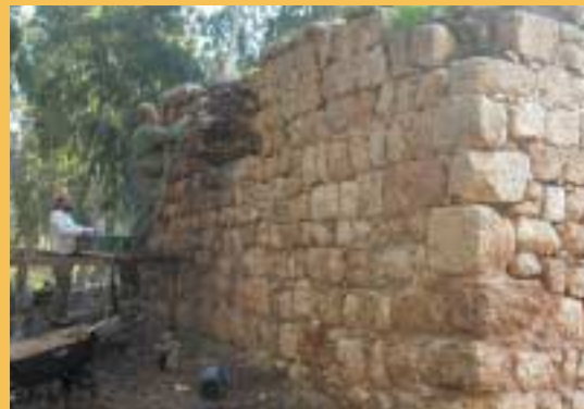
עבודות שימור של טחנת הקמח אל מיר, גן הלאומי ירקון

דיווח וצילם: ד"ר צביקה צוק, הארכיאולוג הראשי ברשות הטבע והגנים