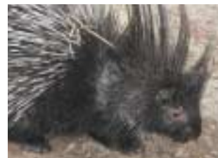
פרט של דורבן

שוטרים במשטרת עפולה, שעצרו לבדיקה רכב חשוד על שני נוסעיו, נדהמו לגלות שני דורבנים שחוטים זרוקים על רצפת הרכב. השוטרים עיכבו את השניים לחקירה והזעיקו את פקחי רשות הטבע והגנים להמשיך את הטיפול בעבירה. ואולם בכך לא