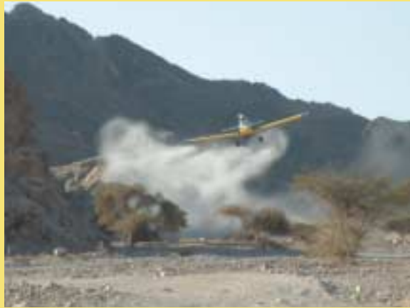
ריסוס נחילי ארבה

כנראה להכנה ליום המחרת כך אפשר לגלות את האזורים שבהם הם מתרכזים ולרכז את הריסוס שם. דיווח: ד"ר בני שלמון, ביולוג מחוז אילת, רשות הטבע והגנים