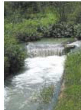
שמורת טבע עין אפק

לא כל העופות הם כאלה. ישנם גם מינים העלולים לגרום נזק למשק המדגה – בעיקר שקנאים וקורמורנים הניזונים בטבע מדגים בלבד. הקורמורן הוא שחיין וגם צוללן טוב, ובדרך זאת הוא משיג את מזונו. לעומתו, השקנאי זקוק לעזרה הדדית בדיג והוא מגיע לכך כאשר להקות חגות בתוך הבריכה ומגרשות את הדגים למרכז.