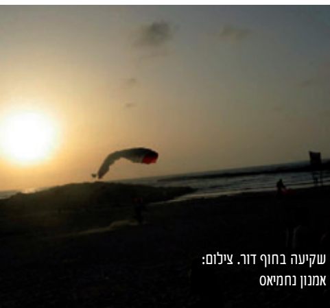
שקיעה בחוף דור.

התל המגוונים והמרשימים מוצג במזיאון המזגגה שבקיבוץ נחשולים (ראה מסגרת). מראש התל תצפית נוף מרהיבה: הים ממערב, שמורת הטבע חוף הבונים מצפון, חוף דור וקיבוץ נחשולים ומושב דור מדרום והכרמל ממזרח.