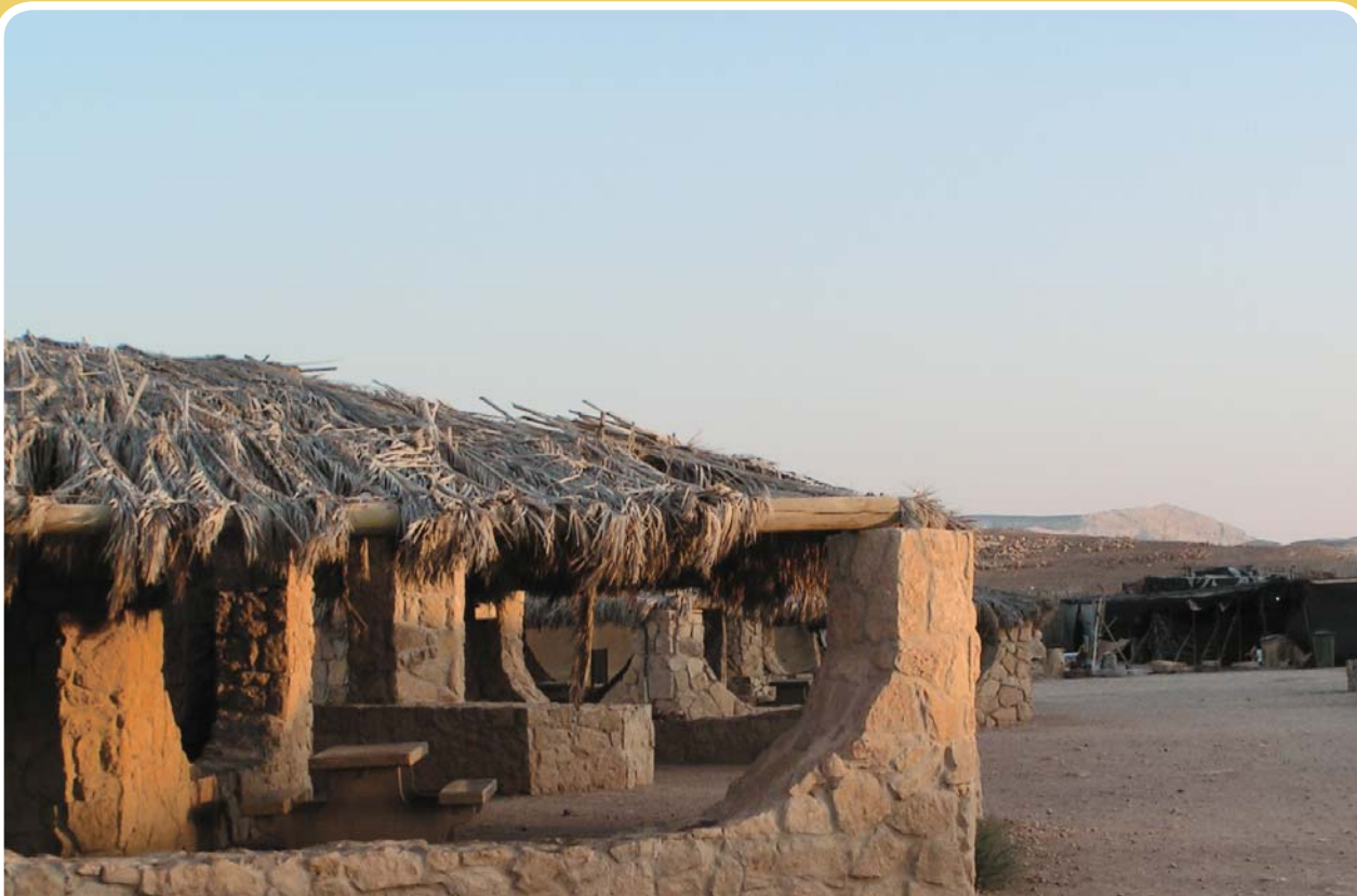
חינון בארות, מכתש רמון

הפקח, בידיעה כי גם קבוצה זו תצבור חוויות רבות שייזכרו לשנים רבות. אגב, בלילה ההוא, ברמת חבר, הפקח אמנם לא פגש את הקבוצה, אבל זכה לביקור מכובד של זוג עופות "רץ המדבר" עם גוזליו, "רחם" אחד שחלף ממעל, אורחת גמלים, ואפילו עקרב צהוב אחד שביקש להזכיר לנו איך יש להתנהג בטבע ומי כאן האדון... ❁