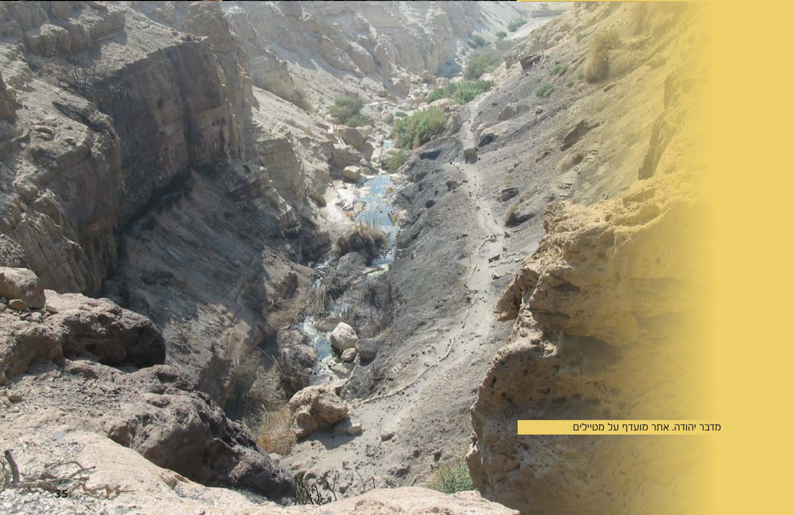
מדבר יהודה. אתר מועדף על מטיילים