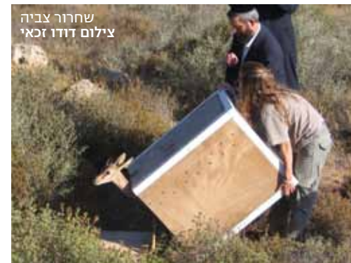
שחרור צביה

צבאים רבים החיים בטבע נפגעים מדי שנה ומגיעים לטיפול וטרינרי ולשיקום בבית החולים לחיות בר של הספארי ורשות הטבע והגנים. לשמחתנו רבים מהם מחלימים לגמרי ומצבם מאפשר את שחרורם בחזרה לטבע. אך האם יסתגלו שוב לחיים בבר? חשוב להבין שלאחר השחרור מתקשות חלק מחיות הבר לשרוד שוב בכוחות עצמן. כדי להקל על הצבאים המשוחררים לטבע את החזרה לחיים עצמאיים, מקיימת למענם רשות הטבע והגנים תוכנית הסתגלות לחיי הבר, שמתבצעת בשמורת טבע גמלא. הצבאים המיועדים לשחרור בחזרה לטבע מועברים למכלאה לזמן הסתגלות של כמה שבועות ורק לאחר מכן משוחררים ממנה, והפקחים עוקבים אחריהם, בודקים את הישרדותם ולומדים על הצטרפותם לעדרים המקומיים. בדרך זו שוחררו בשנתיים האחרונות 16 צבאים, והממצאים מעידים על כ-45 אחוזי הצלחה בשרידות הצבאים שהוחזרו לטבע.