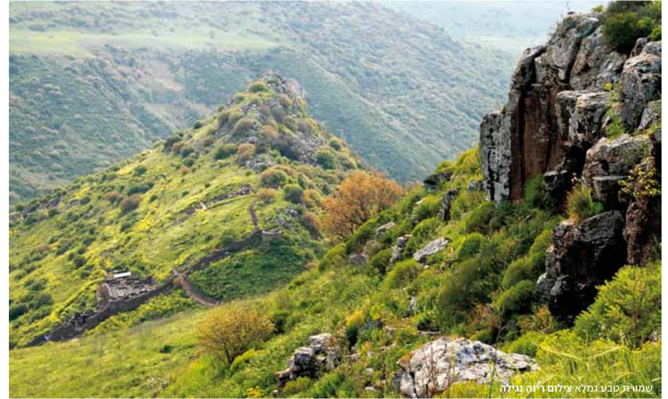
שמורת טבע גמלא צילום רינה נגילה