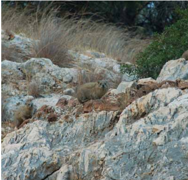
שפני סלע מתגוררים במערות

סלע, כיאה לשמו הערבי של הנחל - "ואדי חרריק", שפירושו "הנחל המבותר". באמצע הדרך יתגלה לפתע מראהו של העמק. מכאן נשקף נוף מרהיב מזרחה לעבר עמק חרוד והרי הגלעד שבעבר הירדן. במצוקים שלשמאלנו אפשר להבחין בפתחי מערות אשר בתוכן מתגוררים דרך קבע שפני הסלע. יש לשער שהזכר הבודד יקבל את פניכם ויצפה בכם בחשש, בעוד הלהקה תציץ בפחד מבעד לחרכים. בהמשך המסלול, מזדקפים קירות הנחל ואפיקו הולך ונעשה צר עד שהוא מגיע למפלים (בחורף הגבים מלאים). את המפלים יש לרדת בזהירות, מי ברגלו ומי על ישבנו. לעזרתכם הותקנו בסלע כמה יתדות. לאחר המפלים מתרחב הנחל בהדרגה עד שהוא מתמזג בעמק. משמאלנו נבחין בחורשת אורנים נוספת. נעבור במעבר מנע זָקָר (המונע מעבר של פרות) ונתקדם לעבר בריכת המים שבעמק, היא נקודת הסיום. מכאן מומלץ להשלים את הטיול באחד מהגנים הלאומיים הסמוכים אליכם: מעיין חרוד, בית אלפא, גן השלושה או בית שאן.