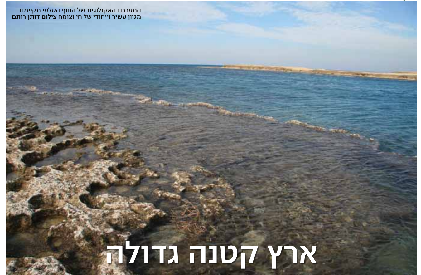
המערכת האקולוגית של החוף הסלעי מקיימת מגוון עשיר וייחודי של חי וצומח

את סלע הכורכר הבהיר, הקשיח למראה אך המתפורר למגע, בעל מראה החריצים המיוחד, אנו מכירים היטב מהמפגש בדרך אל חוף הים ומהרביצה בצלו במשך שעות. במרוצת השנים נכרה הכורכר במקומות רבים ושימש כחומר גלם ליצירת תשתיות או נהרס כדי לאפשר הכשרת שטחים לבנייה במקומו (מעט משטח הכורכר נמצא בשטחים מוגנים כגון שמורות טבע). בשל ייחודו של הכורכר והיעלמותו מנופי