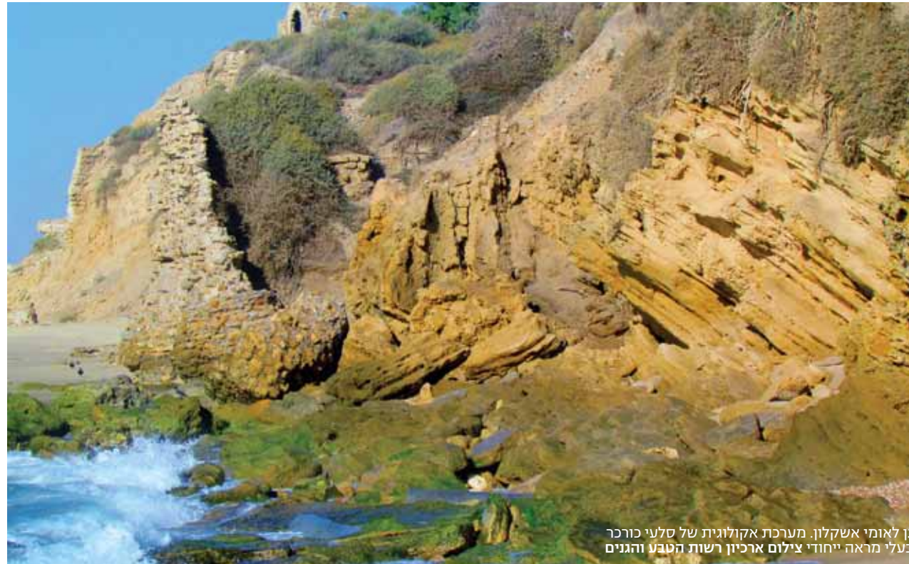
גן לאומי אשקלון. מערכת אקולוגית של סלעי כורכר בעלי מראה ייחודי

איך מגיעים: מצומת המצודות שבקריית שמונה נוסעים מזרחה לכיוון החרמון (כביש 99).