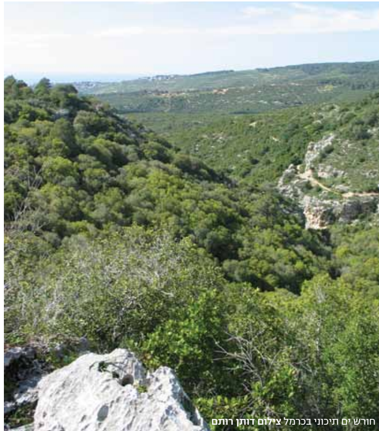
חורש ים תיכוני בכרמל

הארץ הוגדרו כל רכסי הכורכר בישראל כאחת מהמערכות האקולוגיות החשובות בארץ שהצורך בשימורן גבוה.