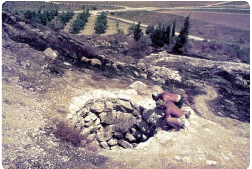
הבאר בפינה הצפון-מזרחית של התל