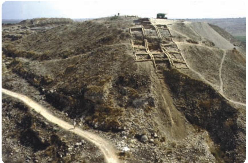
סוללת המצור ששפך הצבא האשורי בפינה הדרום-מערבית של העיר