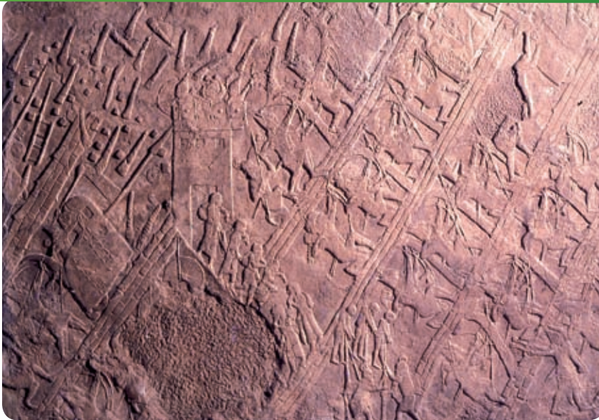
קטע מהתבליט האשורי המתאר את ההתקפה על לכיש. במרכז: איל מצור תוקף את שער העיר