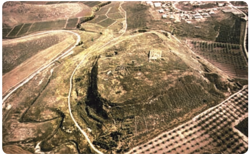
מבט על תל לכיש מכיוון צפון-מערב

כתב: פרופ' דוד אוסישקין, אוניברסיטת תל אביב