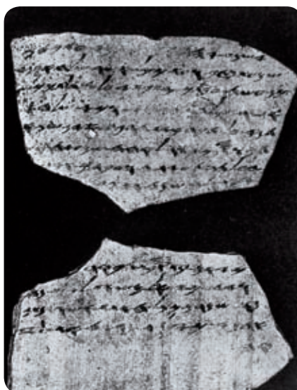
אחד מ"מכתבי לכיש" שנכתבו ערב הכיבוש הבבלי בשנים 586-588 לפנה"ס