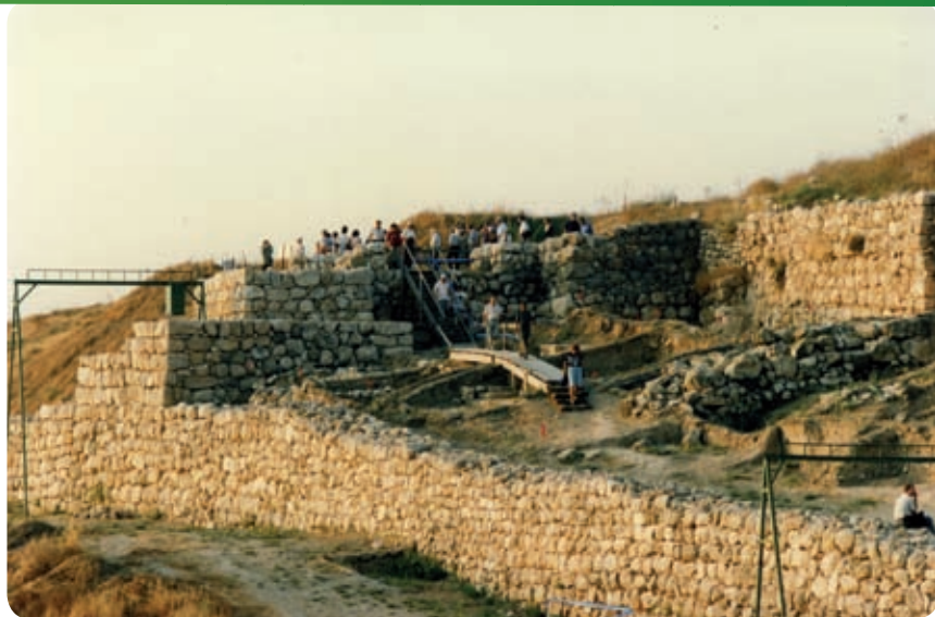
שער העיר המשוחזר חלקית

תל לכיש נחפר כמה פעמים. בין 1932 ו-1938 חפרה כאן משלחת בריטית גדולה, בראשותו של ג'ון סטארקי. החפירה, בין הגדולות ביותר שנערכו בארץ ישראל, הגיעה לקצה הפתאומי בשנת 1938, כאשר סטארקי נרצח בידי פורעים ערבים בדרכו מלכיש לירושלים להשתתף בטקס הפתיחה של מוזיאון רוקפלר. בין 1966 ו-1968 חפר כאן יוחנן אהרוני. חפירתו הייתה מוגבלת הן במטרותיה והן בהיקפה, והתרכזה באזור "מקדש השמש" מהתקופה הפרסית. בין 1973 ו-1993 חפרה כאן משלחת גדולה מטעם אוניברסיטת תל אביב בראשותו של פרופ' דוד אוסישקין. המשלחת התרכזה בחקר שרידי העיר מתקופת מלכי יהודה. עם סיום החפירות החלו עבודות שחזור בשער העיר ועבודות הכנה לפתיחת האתר כגן לאומי. עבודות אלו נפסקו באמצע מחוסר תקציב. בקרוב יחודשו העבודות לקראת פתיחת האתר כגן לאומי לקהל.