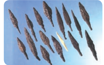
ראשי חצים מברזל ואחד מעצם, שנמצאו באזור ההסתערות על החומה