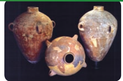
קנקנים מטיפוס "למלך". אחד מהם נושא טביעת חותם עם סמל ארבע-כנפי והכתובת "למלך חברון"