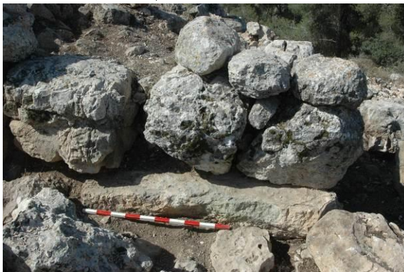
מראה פרט של המגדל במערב המצודה