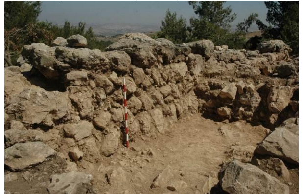
הקיר המערבי של המצודה, מבט לכיוון מערב