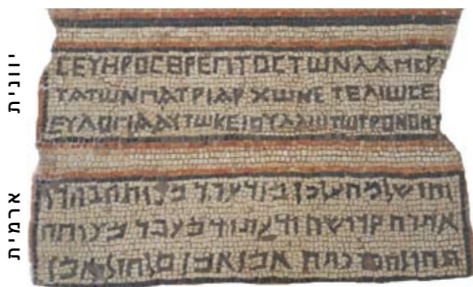
תרגום הכתובת מארמית: "יהי שלום על כל מי שעושה צדקה במקום הקדוש הזה ומי שעתידי לעשות צדקה תהיה לו הברכה. אמן אמן סלה ולי אמן"

תרגום הכתובת מיוונית: "סוורוס, חניך הנשיאים המזהירים ביותר, השלים (את הבניין) תבוא עליו הברכה ועל יוליוס הפרנס".