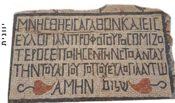
תרגום הכתובת: "זכר לטוב ולברכה פרופוטורוס הזקן (אשר) עשה את הסטו (שדרת עמודים מקורה) הזה של המקום הקדוש. ברכה עליו, אמן. שלום"

בית הכנסת השני התקיים במאות 4-3 לסה"נ והותיר אחריו רצפת פסיפס מפוארת, שהיא רצפת הפסיפס הקדומה ביותר שהתגלתה בבתי הכנסת בארץ. הפסיפס מחולק לשלושה סְפִינִים ("שטיחים"). בשטיח הצפוני מתוארים שני אריות וביניהם תשע כתובות הנצחה לתורמים ביוונית; במרכזי מתואר גלגל מזלות מרהיב המקיף את דמותו של הליוס, אל השמש; ובדרומי מתוארים ארון קודש וסמלים יהודיים כגון שתי מנורות שבעת קנים, שופר ולולב.