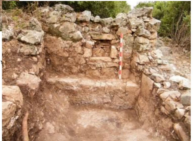
איור 6 - הקיר האחורי (דרומי) של חדר המשמר