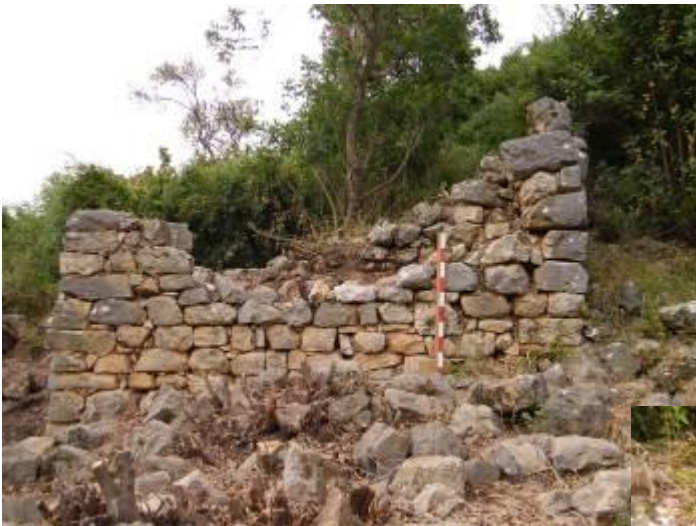
איור 4 - רצפת אבן מול קיר W3 וחפירת הבדיקה אל מפלס הרצפה הקדומה

מול השער נחפר מבנה קטן (איור 5) ששימש כנראה את שומרי השער. החפירה הגיע בחלק מהחדר עד הרצפה ועליה נמצאו סימני שריפה. הממצא החומרי דומה לאלו שנמצאו בריבועי החפירה האחרים – מסמרים כלי חרס ועוד. בירכתי החדר ישנה גומחה בקיר ומתחתיה ספסל (איור 6).