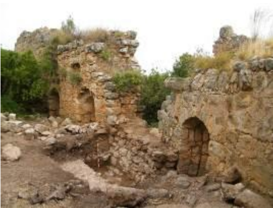
איור 2 – החומה הקדומה מימין, החומה המאוחרת משמאל ובאמצע הקיר המגשר ביניהם שנחשף בחפירות

אחת ממטרות הפרוייקט היתה לבדוק את החומה החיצונית המשתרעת בצד הצפוני והמערבי של המבצר (איור 1). החומה נבנתה כאן בשני שלבים (איור 2) ובכמה מקומות השתמרה לגובה המקורי. המפגש בין שני קירות החומה כאן הוא יוצא דופן כי קטע קיר אחד נפגש עם הקטע השני בתפר שבו הפן הפנימי של קטע אחד נפגש עם הפן החיצוני של הקטע השני. אנומליה זו מוסברת בהחלקה של הקירות במורד התלול, או פעילות טקטונית או נזקים בעקבות המצור.