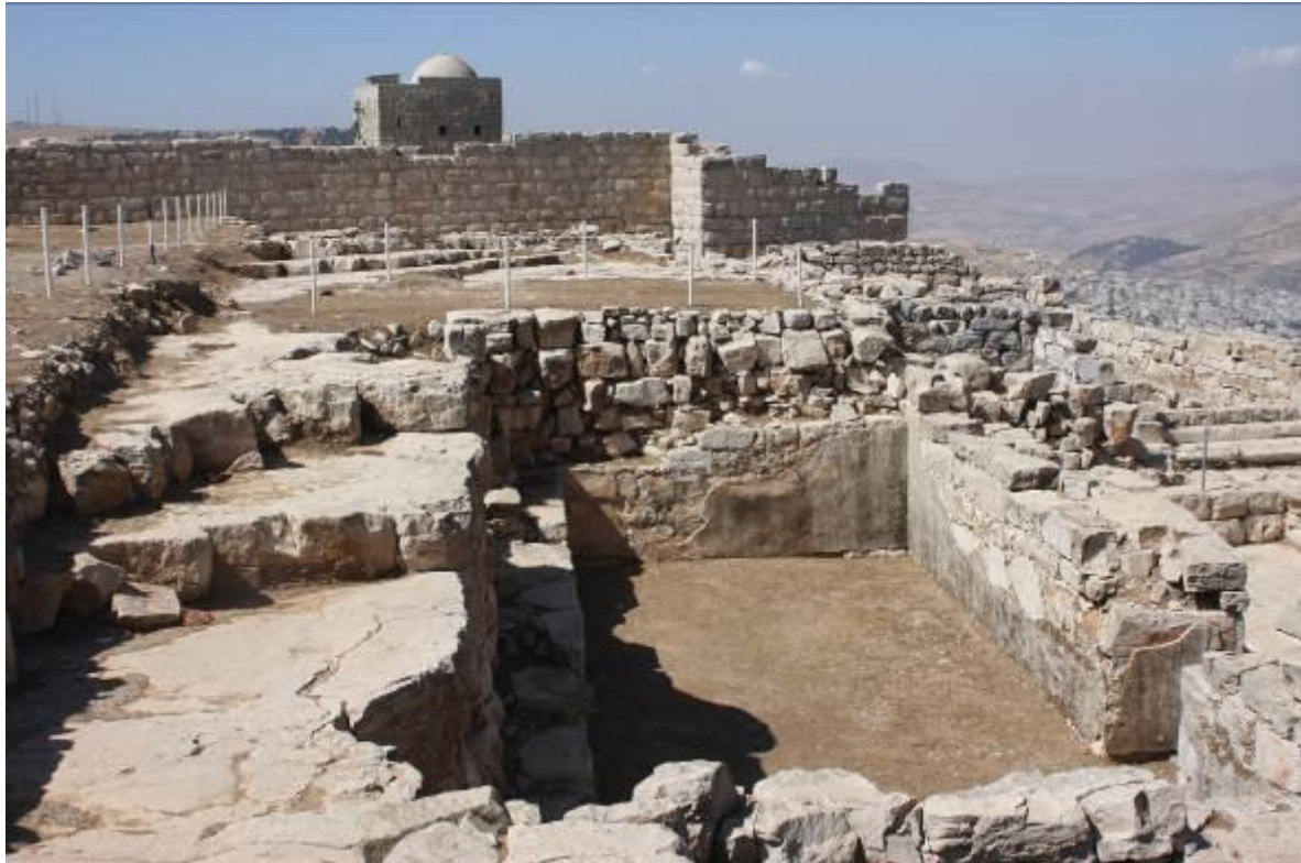
פתרון החידה הקודמת