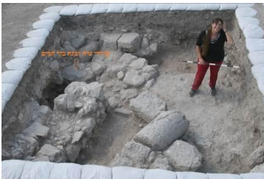
איור 3 : בור המים בשטח חפירות A