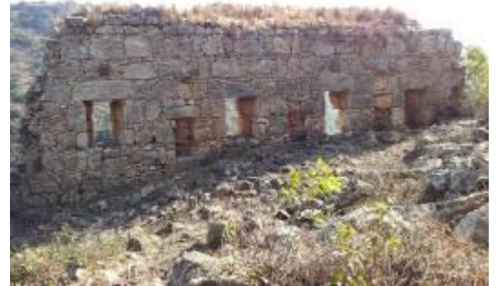
איור 4 : העמודים שבמרכז האורווה