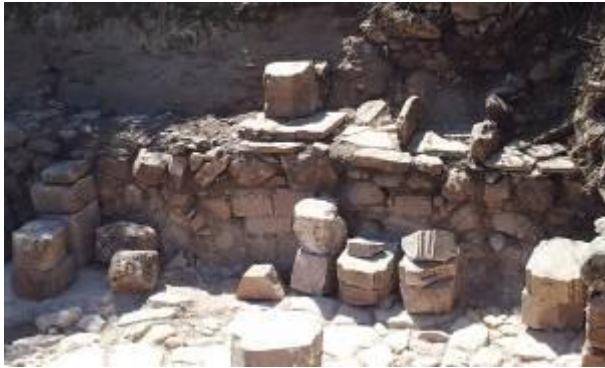
איור 5 : רצפת האבן