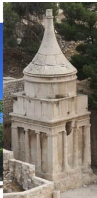
יד אבשלום 19.70 מ' גובה