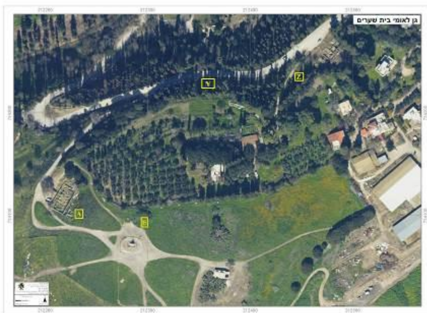
איור 1: שטחי החפירה על רקע מפת צילום