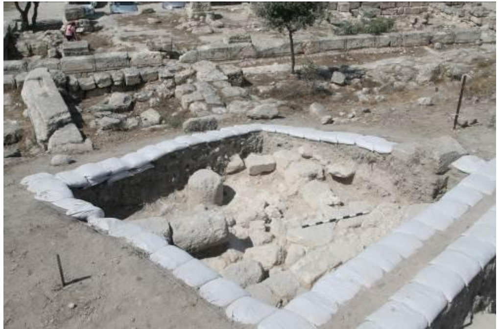
איור 2 : שטח חפירות A. ברקע הבזיליקה.

בעונה הבאה נרחיב את שטחי החפירה הנוכחיים ואף נפתח שטחים נוספים ברחבי הגבעה כדי להבין את אופי היישוב והיקפו, וזאת בתיאום עם הגורמים המעורבים ועם התושבים הגרים על הגבעה.