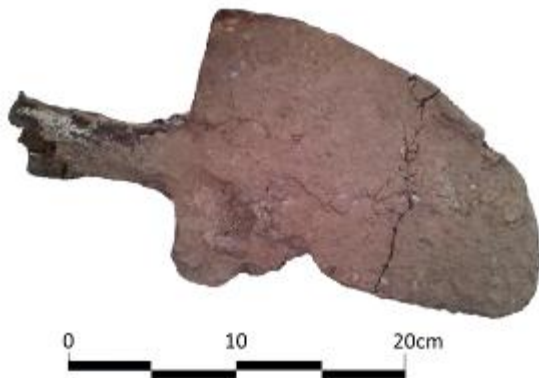
איור 7 : את חפירה