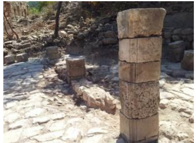
איור 6 : שקתות על הבמה בצד הדרומי של האורווה