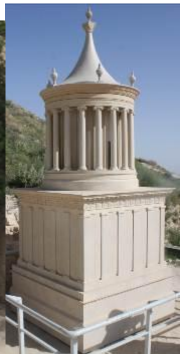
מודל קבר הורדוס 25 מ' גובה במקור