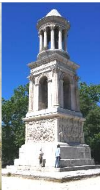
גלאנוס 2013 17 מ' גובה