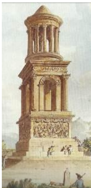
גלאנוס ציור משנת 1792?

מבנה נוסף נמצא בחבל פרובאנס בצרפת, בעיר העתיקה גלאנוס שליד סן רמי. זהו המאוסוליאום של משפחת יוליוס. שלושת האחים סקטוס, לוציוס ומרקוס ממשפחת יוליוס בנו את המבנה להוריהם ולאחיהם הבכור. פסלי האב והאח מצויים בחלק העליון של המבנה בתוך התולוס. המדהים הוא שהמבנה לא נהרס מאז העת העתיקה ולראייה ציור מסוף המאה ה-18. בשנת 2008 נוקה הבניין מפיח שחור שנצבר עליו מזהום אוויר של כלי רכב. המבנה מחולק ל-5 חלקים: מסד, בסיס מרובע עם תבליטים, 'טרפילון' (קובייה מרובעת עם 4 שערים) עם תבליטים, תולוס וגג חרוטי. התבליטים של ה'טרפילון' מעוטרים בעלי אקנטוס המסמלים את הנצחיות של הלידה מחדש ועל אבן הראשה גורגונה שתפקידה להגן על הקבר. טריטונים מעבירים את גלגל השמש מעל האוקיאנוס תוך הרחיקם אותה ממפלצות ימיות. התבליטים על הבסיס מתארים קרבות של פרשים, אמזונות והמלחמה בין יוון לטרויה. המאוסוליאום מתוארך למחצית השנייה של המאה ה-1 לפנה"ס ובכך הוא בן זמנו של המאוסוליאום שבהרודיון. מומלץ מאוד לבקר במקום במסגרת ביקור בפרובאנס. מבנים נוספים בעלי ארכיטקטורה דומה נמצאו באיטליה, יוון וצפון אפריקה.