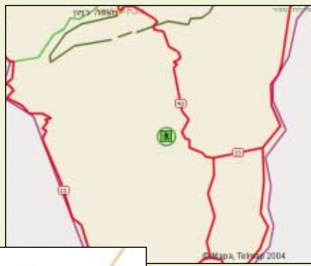
מסלול בקניון עדה ותצפית על הר כרכום

מיד עם הפנייה לכביש 40, עוקבים אחרי הסימון האדום. נוסעים בסמוך לערוץ הנחל ולעייתים הדרך חוצה אותן – רוב ימות השנה הדרך נוחה לעבירות גם לכלי רכב רגילים. אחרי 2.5 ק"מ תופיע התפצלות שמאלה עם סימון שביל כחול. בנקודה זו משאירים את הרכב. לא לשכוח לקחת עימכם את כל חפצי הערך! כאן מתחיל הטיול הרגלי: ההליכה עוברת בשביל צר ואיתו עולים לחלק העליון של הקניון. העלייה אינה קלה אולם שווה את המאמץ. הכיוון בשלב זה הינו דרום, כשפנינו לעבר שמורת הר הנגב, ובאופק נראים צוקי אוביל. אחרי כשני ק"מ, השביל פונה לצפון מזרח ואנו עדיין בקו הגובה של הקניון. לאחר כק"מ נוסף מגיעים לתצפית ממנה נוכל להשקיף על הר עריף, הר כרכום וצוקי פארן. מהתצפית השביל מתחיל לרדת, ומכאן מתחיל הנקיף שהוא 200 מטרים