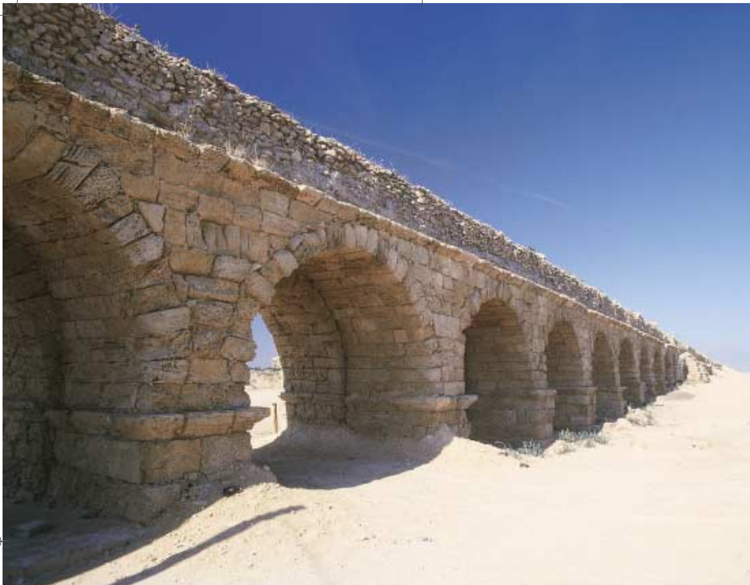
חוף הקשתות, קיסריה