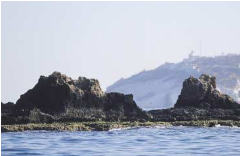
איי חוף אכזיב

מנזר האחיות ציון. האורן 23, עין כרם, טל': 02-6415738, 02-6430887. אתר קק"ל "הסטף", הרי ירושלים. קו ליער: 350-350-800*1.