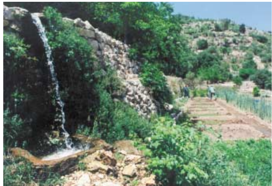
אתר הסטף, ירושלים

הגעה לעין כרם: מכביש לירושלים פונים ימינה (ומערבה) לרחוב הרצל וממשיכים עד הר הרצל, בצומת בית וגן פונים מערבה ויורדים עד לעין כרם. לבאים מכביש ת"א-ירושלים, דרך מחלף הראל (כביש מס' 1) פונים במבשרת לכיוון צובה והסטף. בצומת כרם פונים מזרחה ועולים בכביש לשכונת עין כרם. משם לסטף: כביש מס' 395 היוצא מעין כרם שבדרום-מערב העיר.