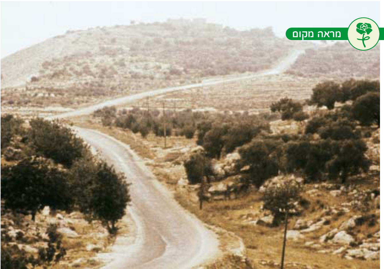
מעלה בית חורון, זמן קצר לאחר מלחמת ששת הימים