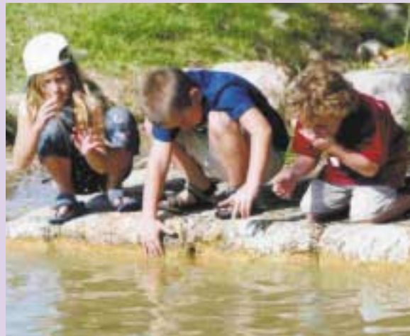
עמק המעיינות, פארק איילון-קנדה

סוג: לכל המשפחה, נסיעה ברכב משולבת בהליכה. אורך מסלול: 4 ק"מ. משך הטיול: 2-3 שעות. הגעה: מכביש ירושלים-תל אביב, סמוך לצומת שורש (כביש מס' 1, ליד סימן ק"מ 45). הכניסה לחניון אפשרית משני כיווני הנסיעה. ניתן להיכנס לפארק גם חצי קילומטר ממערב לצומת שורש, בין סימני ק"מ 45-46 או ליד תחנת הדלק פז בצומת שער הגיא. הגישה בשני מקרים אלה היא מכיוון ירושלים בלבד. הגישה לאתר המרכזי בעמק המעיינות ולבוסתני תל איילון: פונים בצומת לטרון לכיוון מבוא חורון ורמאללה (כביש מס' 3). פארק איילון משתרע במרחק של כקילומטר מהצומת. כניסה: חופשית.