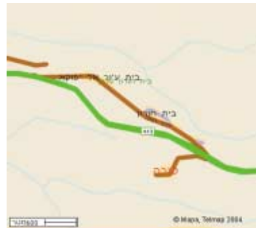
מפת האזור

ירושלים דרך עמק איילון בכביש מס' 1. במחלף לטרון יש לרדת לכביש מס' 3 המוביל למבוא חורון, לחלוף על פני פארק קנדה (ראו מסגרת), ולהגיע עד למחסום צה"ל, ממנו יש לפנות לתוך העיר מודיעין, לחבור לכביש 443 ולנסוע לישוב רעות. מן הכניסה לרעות יש לנהוג במעלה כביש שיובילכם לעבר בריכת המים של הישוב. ממרומי גבעת הברכה תוכלו לערוך תצפית על מעלה בית חורון ועל כל מרחב הקרבות של יהודה המקבי. לא לשכוח להצטייד בספר מקבים א' (הניתן להשגה בכל ספרייה שמכבדת את עצמה). שובו לכביש 443 וסעו מערבה לכיוון כפר רות, לצומת שילת. מיד אחרי שילת תבחינו בשלט מאיר עיניים המבשר שהגעתם אל מקום הקברים.